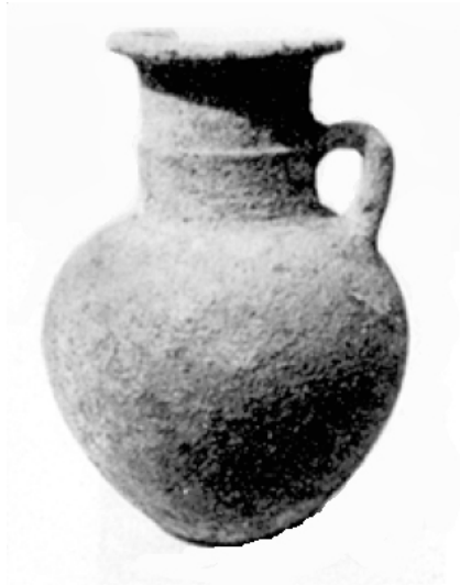
Fig. 3 - Urne provenant du tophet de Motyé, de la première moitié du VII e siècle avant J.-C. (CIASCA ET ALII/1973, pl. XLIII, 1)