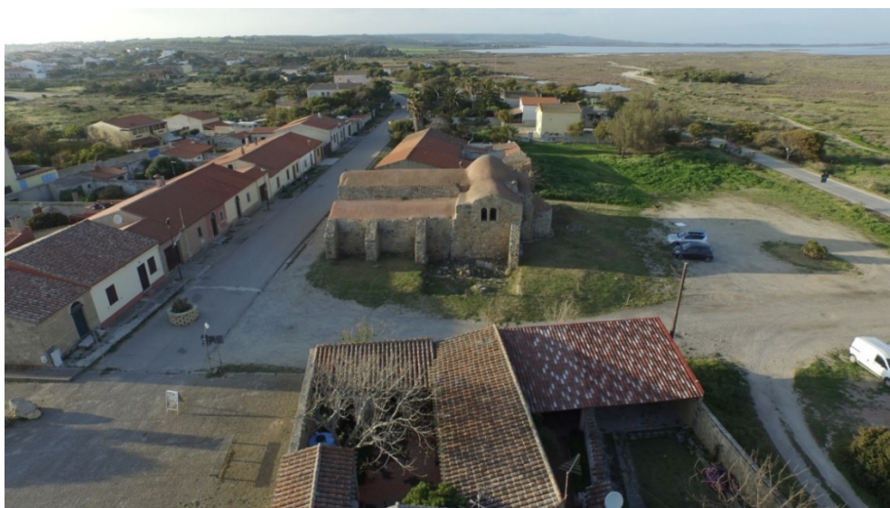
Fig. 2 - Église San Giovanni