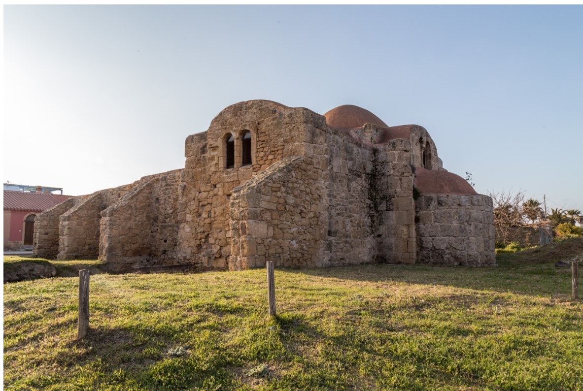
Fig. 7 - Abside de l'église San Giovanni