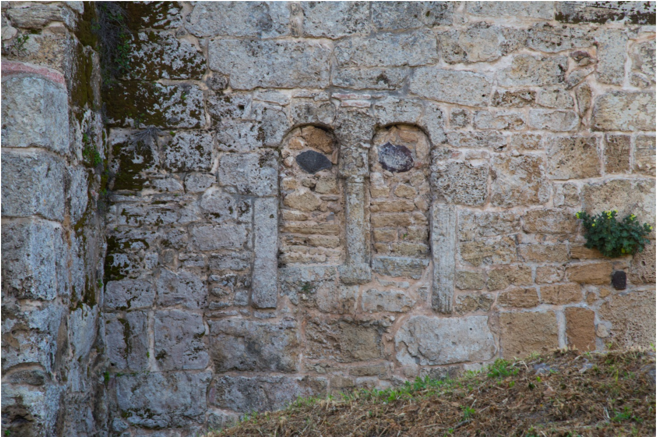
Fig. 8 - Détail d'une fenêtre à double baie fermée

Une grande partie des blocs utilisés pour la construction du premier et du second bâtiment ecclésiastique ont été recyclés et proviennent de la proche cité de Tharros, selon une pratique connue et bien consolidée.