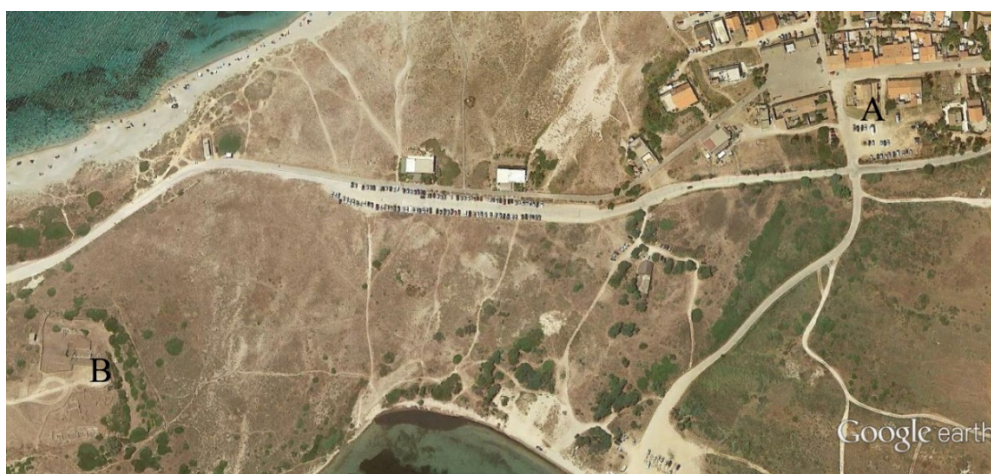
Fig. 1 - Localisation de l'église San Giovanni par rapport à Tharros : A) l'église ; B) Su Muru Mannu (Google Earth. Réélaboration C. Tronchetti)

Sur la route qui mène de Tharros à Cornus, dans une nécropole d'abord païenne puis chrétienne, on construisit, à une époque incertaine probablement située entre le VI e et le VII e siècle après J.-C., une petite basilique paléochrétienne, dont il reste les ruines d'une structure en abside, démolie et en partie réutilisée pour réaliser les fondations de l'église postérieure San Giovanni (fig. 1-3).