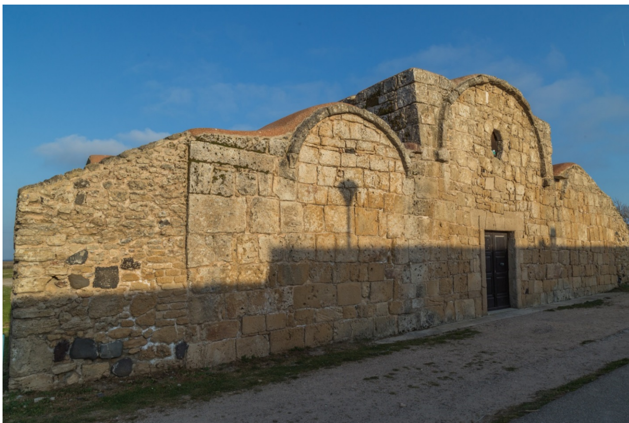
Fig. 6 - Façade de l'église San Giovanni