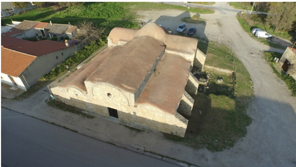
Fig. 5 - L'église San Giovanni