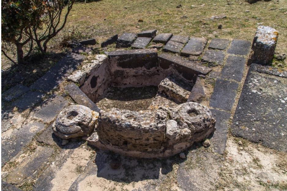
Fig. 4 - Les restes du baldaquin du baptistère

Le bassin était sans doute couvert d'un baldaquin comme l'indiquent les impostes de deux colonnes du côté nord (fig. 4).