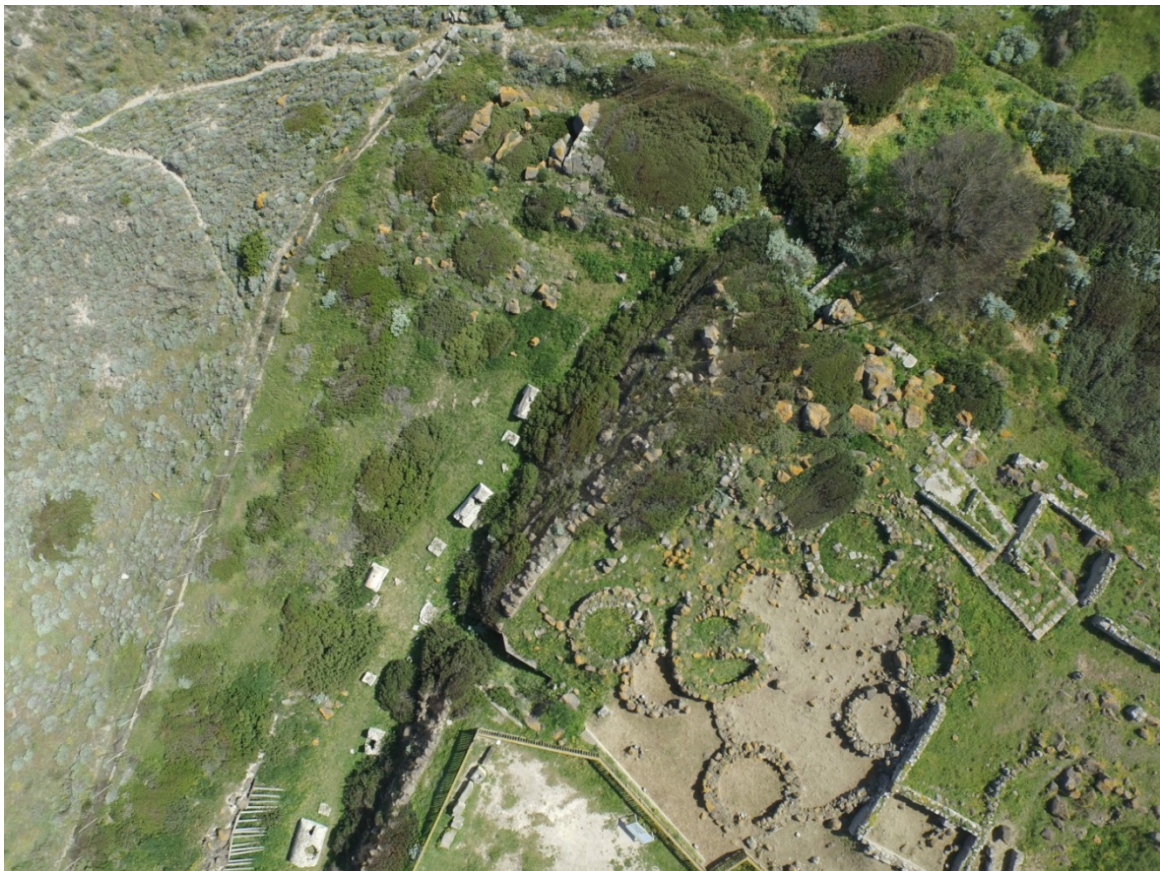
Fig. 1 - La nécropole dans le fossé de Su Muru Mannu

Vers l'an 50 avant J.-C., on réalisa sur la colline de Su Muru Mannu, à l'intérieur du fossé partiellement rempli, une petite nécropole du début de la période impériale (fig. 1).