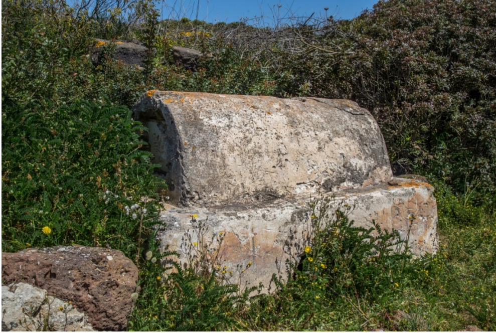
Fig. 6 - Tombe à cupae dans le fossé de Tharros

Ces tombes étaient parfois décorées d'une peinture qui imitait les crustae en marbre (fig. 7) ; dans certains cas, on conservait un repas sacré symbolique en l'honneur du défunt sur l'autel situé face à la tombe (fig. 8).