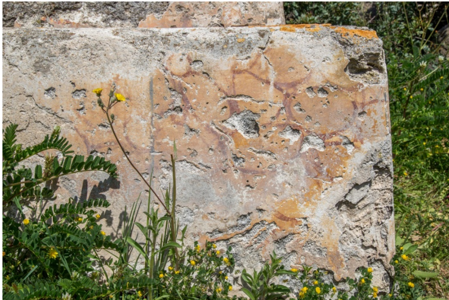
Fig. 7 - La décoration peinte et imitant la crusta en marbre

Ces tombes étaient parfois décorées d'une peinture qui imitait les crustae en marbre (fig. 7) ; dans certains cas, on conservait un repas sacré symbolique en l'honneur du défunt sur l'autel situé face à la tombe (fig. 8).