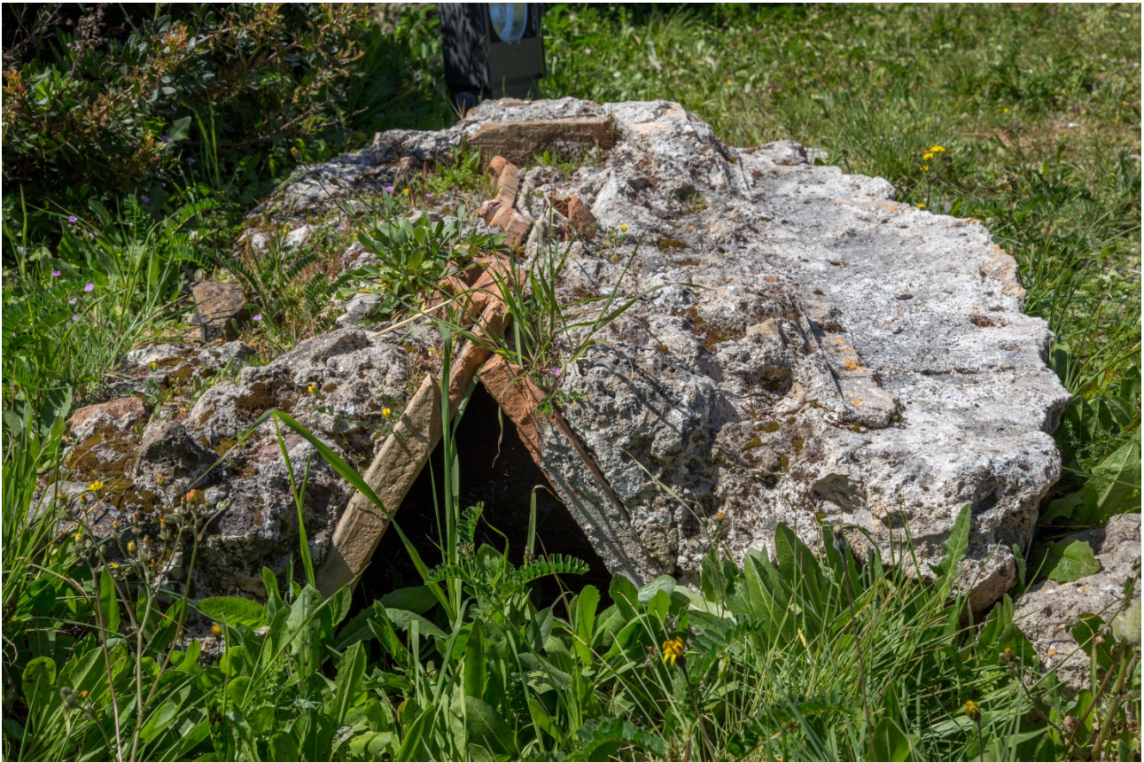
Fig. 9 - Tombe à la cappuccina englobée dans le tumulus à cupae

Le tumulus en opus caementicium crépi contenait la tombe qui pouvait être à la cappuccina (fig. 9) ou un simple caisson en pierre.