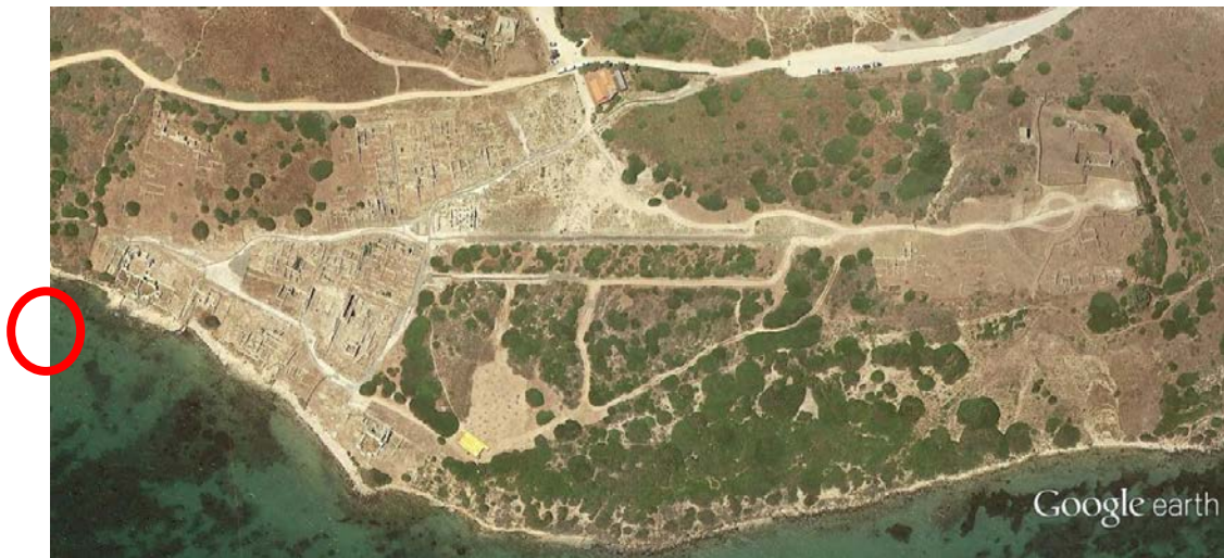
Fig. 1 - Localisation des Thermes de Convento Vecchio (Google Earth. Réélaboration C. Tronchetti)

Les Thermes de Convento Vecchio, situés sur la rive en direction du Golfe d'Oristano (fig. 1-3), doivent très vraisemblablement leur nom à l'usage que l'on fit des structures à la fin de l'Antiquité, transformées en un petit Couvent de moines, dont la seule attestation pourrait être une tombe de la période byzantine découverte dans l' apodyterium du bâtiment (fig. 4).