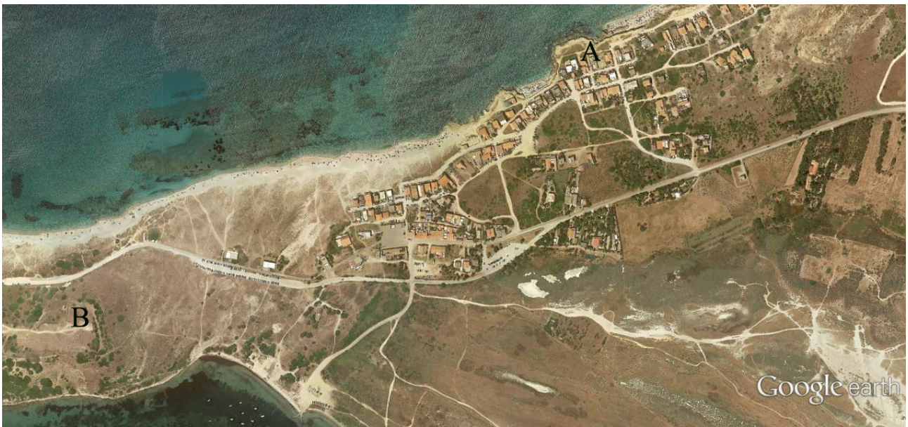
Fig. 1 - Localisation de la nécropole septentrionale de Tharros. A) la nécropole ; B) colline de Su Muru Mannu (Google Earth. Réélaboration C. Tronchetti)

La cité phénicienne-carthaginoise de Tharros possédait deux noyaux de nécropoles, disposés au nord et au sud du village. La nécropole septentrionale, située à environ 1 km de la colline de Su Muru Mannu, est intégrée au périmètre de l'agglomération actuelle de San Giovanni di Sinis, au bord de la mer, et elle a subi des dégâts à l'époque moderne suite à l'activité d'une carrière (fig. 1).