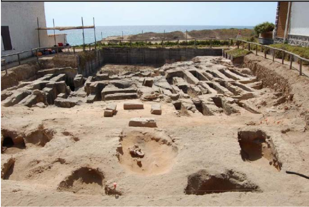
Fig. 2 - Vue de la nécropole septentrionale de Tharros au cours des fouilles (DEL VAIS, FARISELLI, 2012)

Des tombes à fosse phéniciennes à incinération ont été découvertes, datables d'entre la fin du VIIe et le VIe siècle av. J.-C., certaines avec une couverture soignée faite de moellons qui recouvrait la fosse avec les cendres et les objets du défunt (fig. 3-5).