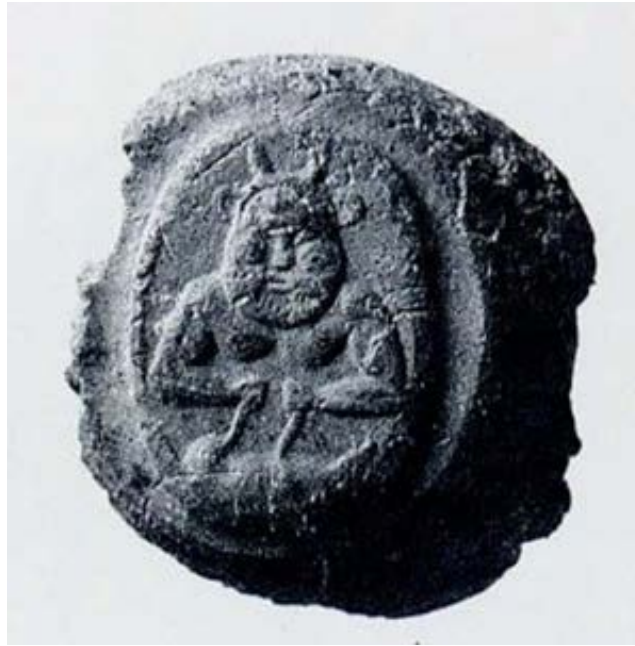
Fig. 7 - Crétule provenant de Carthage (Redissi 1999, n. 69).

La plupart des scarabées sardes semble provenir de Tharros, qui a sans doute été un des principaux centres de production et d'exportation de la Méditerranée carthaginoise. Ceci dit, le matériel provenant de Sulci n'apparaît pas particulièrement riche. Les fouilles réalisées au cours de la dernière décennie en ont restitué un nombre important, non seulement en pierre dure mais aussi en stéatite ou en pâte de verre ; signalons en particulier deux pièces d'une facture élaborée, datant de la période comprise entre le VII e et le début du VI e siècle avant J.-C., tous deux importés, probablement d'Égypte (fig. 8) et de Phénicie (fig. 9) : ce dernier est particulièrement intéressant en raison de l'inscription en langue phénicienne, un détail qu'on retrouve difficilement sur les scarabées de l'Occident carthaginois.