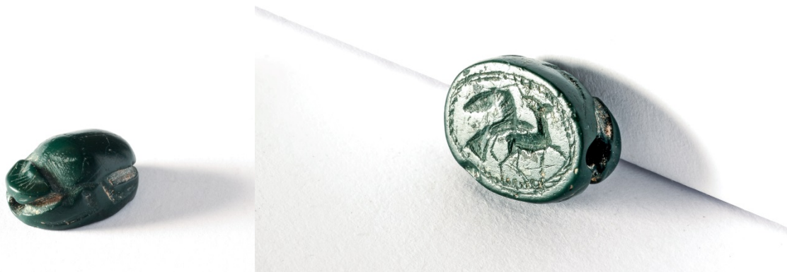
Fig. 6 - Dos et ovale de base du scarabée en jaspe vert avec l'iconographie d'un cerf saisi par un aigle, Musée Archéologique Communal « F. Barreca ».

La cornaline est la deuxième pierre la plus diffuse dans la glyptique carthaginoise, et en particulier sarde, après le jaspe vert, qui est la pierre la plus utilisée pour cette catégorie de matériel (fig. 6). On utilisait également l'agate, le cristal de roche et la calcédoine. Mais différents exemplaires, surtout de la période phénicienne (VII e -VI e siècle avant J.-C.) sont en pâte de verre ou en stéatite.