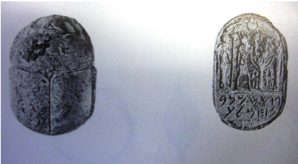
Fig. 9 - Scarabée avec hiéroglyphe provenant de la collection Biggio de Sant'Antioco (Moscati 1988, tab. XXXI, fig. 5).