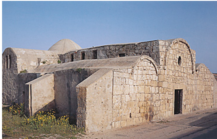
Fig. 3 - Église San Giovanni de Sinis.

Le bâtiment d'origine est aujourd'hui entièrement englobé entre des corps de fabrique différant par l'âge, la conformation architecturale et la destination fonctionnelle.