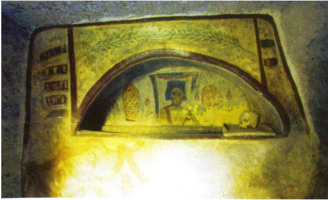
Fig. 8 - Arcosolium peint de la nécropole d' Is Pirixeddus (Bartoloni 2007, p. 50, fig. 31).