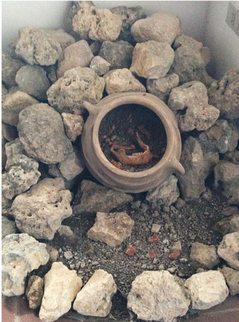
Fig. 2 - Reconstruction d'une sépulture à enchytrismòs pour les enfants en bas âge ( http://upload.wikimedia.org/wikipedia/commons/2/2e/Eempio_di_sepoltura_ad_Enchytrismos.JPG ).

Pour les sépultures d'adultes, étant donné que les amphores étaient trop petites pour en contenir le corps, on en utilisait deux, qui, une fois coupées au niveau de l'épaule dans le sens transversal puis de nouveau dans le sens de la longueur pour permettre l'introduction du corps, étaient ensuite unies de manière à former un récipient unique pour la dépouille (fig. 3).