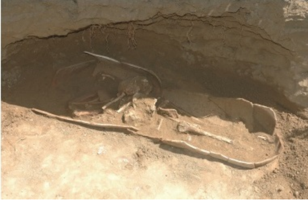
Fig. 3 - Tombe à enchytrismòs réunissant deux amphores pour permettre la sépulture d'un adulte, dans la nécropole d'Agrigente, durant l'Antiquité tardive et au Moyen-Âge (Caminnecci 2012, p. 123, fig. 11).

À l'époque carthaginoise, les tombes à enchytrismòs apparurent à la fin du VI e siècle avant J.-C. et on les utilisa jusqu'au début du IV e siècle après J.-C. Elles étaient réalisées avec de grandes amphores commerciales et il a été démontré qu'on ensevelissait les enfants morts avant la puberté dans une zone dédiée à l'intérieur de la nécropole, séparée de celle des adultes.