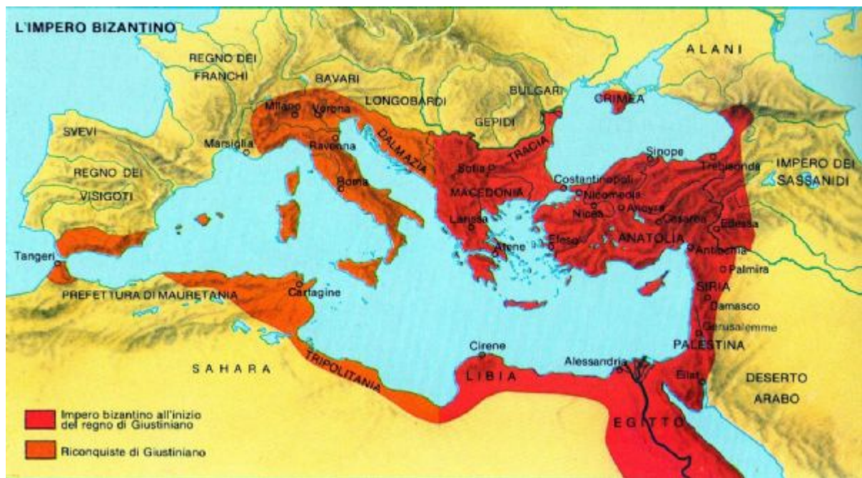
Fig. 6 - L'empire byzantin à l'époque de Justinien.