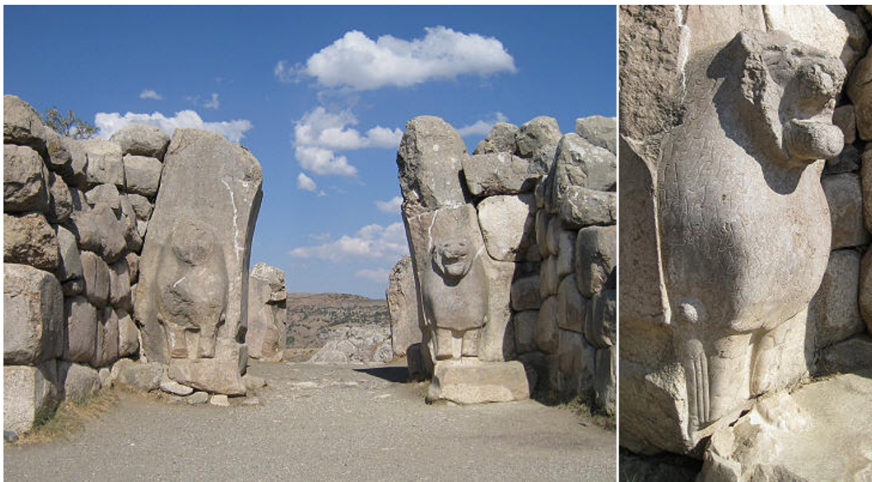
Fig. 6 - La porte des Lions d'Hattuša en Anatolie ( http://romeartlover.tripod.com/Hattusa6.jpg ).

derniers le résultat d'une fusion d'éléments stylistiques et iconographiques, que l'on retrouve également dans la Grèce archaïque et en Étrurie.