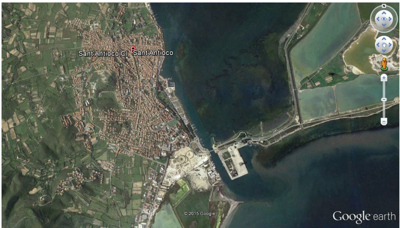
Fig. 1 - Vue de l'actuel village de Sant'Antioco. On aperçoit bien l'isthme qui relie l'île mineure et l'île majeure.

Sant'Antioco est et la plus grande île de l'archipel de Sulcis, situé au sud-ouest de la Sardaigne, choisi par les Phéniciens pour sa position et son port naturel. Elle a une surface d'environ 88 kilomètres carrés, une longueur d'environ 19 km. Le territoire est constitué par des roches volcaniques, essentiellement des basaltes et des trachytes, et du calcaire et elle est reliée à l'île principale par un isthme, en partie réalisée par l'homme (Fig. Les cours d'eau essentiellement à caractère torrentiel sont plutôt rares.