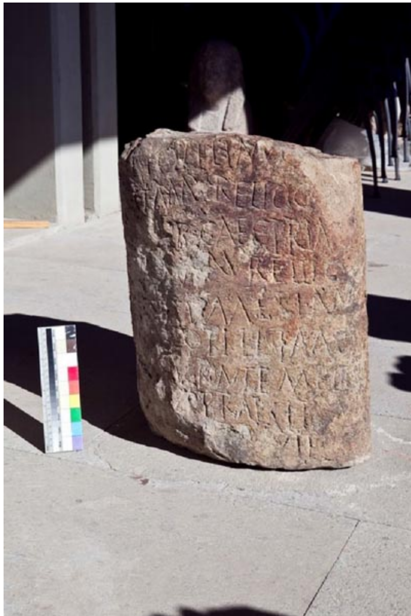
Fig. 2 - Borne milliaire posée par le praeses Marco Elio Vitale en 282-283 ap. J.-C..

La borne milliaire découverte vers 1820 près de Fordongianus (fig. 2-3) avait été posée par Marco Elio Vitale, praeses (gouverneur) de la provincia , un personnage déjà mentionné dans une autre inscription retrouvée à Olbia.