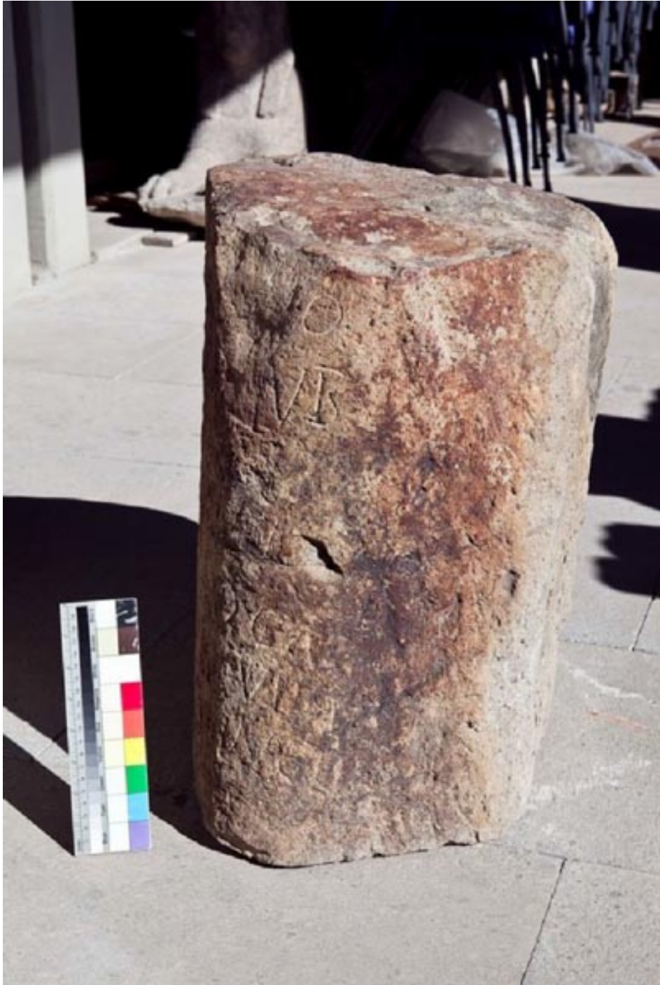
Fig. 3 - Borne milliaire posée par le praeses Marco Elio Vitale en 282-283 ap. J.-C. (photo N. Monari, Archives RAS).