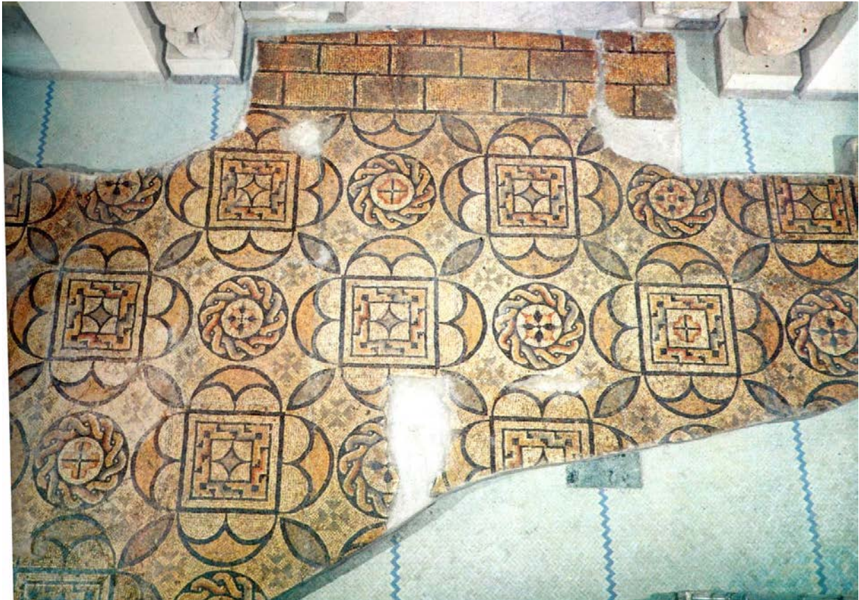
Fig. 1 - Fordongianus. Mosaïques d'une maison romaine découvertes sous le village moderne (fin II e -III e siècle ap. J.-C.) (Angiolillo 1981, tab. XLIV).

Au cours des travaux occasionnels réalisés dans une maison située au 16 de la Via Vittorio Emanuele, on découvrit un grand fragment irrégulier de sol en mosaïques (mesurant au maximum 9,15x3,40 m, fig. 1).