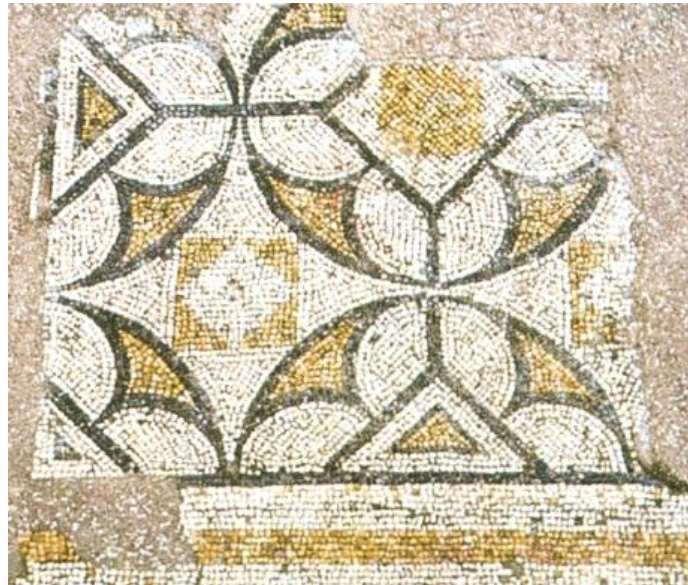
Fig. 2 - Porto Torres, Thermes de Palazzo di Re Barbaro (III e siècle ap. J.-C.) (Angiolillo 1981, tab. XLV).

local qui reprenait des motifs africains, en activité au cours de la période comprise entre la fin du II e et le début du III e siècle de notre ère. Les couleurs des mosaïques, reprenant essentiellement les couleurs des terres, sont en général parallèles aux productions contemporaines de mosaïques sur l'île, comme les exemplaires retrouvés dans le soi-disant « Palazzo del Re Barbaro » (Palais du Roi Barbare) à Porto Torres et celui du soi-disant « Nymphée » de Nora (fig. 2-4).