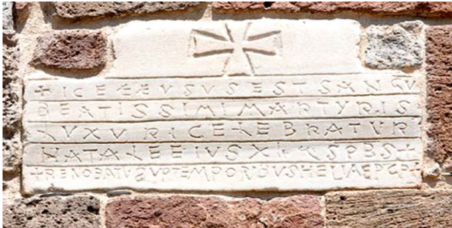
Fig. 2 - Inscription datant du VI e siècle commémorant le martyr de Luxurius.

Les fouilles ont mis au jour une inscription (fig. 2), actuellement noyée dans le mur de l'église, évoquant le martyr du Saint, définit « martyr béatissime », posée par l'Évêque Elia ; les caractères de cette inscription permettent de la dater du VI e siècle ap. J.-C.