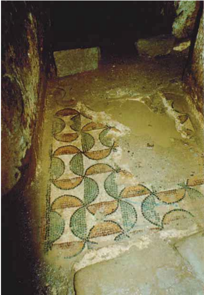
Fig. 4 – Sol en mosaïques de la crypte de l'église San Lussorio (Zucca 1986).

Au VII e siècle, les bâtiments se dégradèrent et on les remplaça par une chapelle qui tomba elle aussi en ruine. Le bâtiment actuel fut construit par les Moines Victorins de Marseille au début du XII e siècle avant d'être restructuré suite à un effondrement.