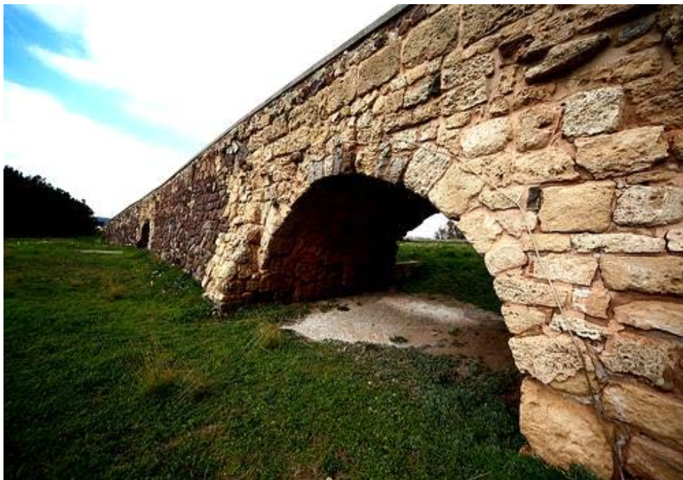
Fig. 3 - Sant'Antioco, pont construit sur les vestiges du pont romain