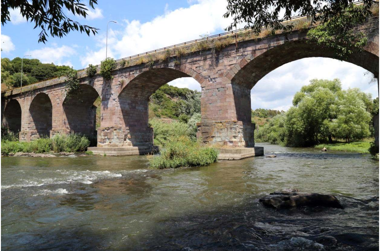
Fig. 4 - Pont sur le Tirso à Fordongianus : les piliers modernes sont ancrés dans le socle de l'ancien pont romain.

Dans le cas du pont de Fordongianus (fig. 4), la base des piliers semble avoir été réalisée en opus quadratum , tout comme la structure des Thermes I. Par conséquent, on suppose que le pont date de la même époque que les Thermes, et qu'il faisait partie du processus d'aménagement du centre à l'époque de Trajan.