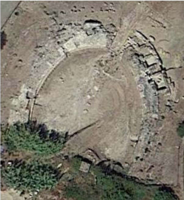
Fig. 1 - Image de l'amphithéâtre de Fordongianus durant les fouilles.

L'amphithéâtre de Forum Traiani a été bâti dans la petite vallée appelée Apprezzau, et il se situe dans la périphérie au sud de la cité romaine (fig. 1-2).