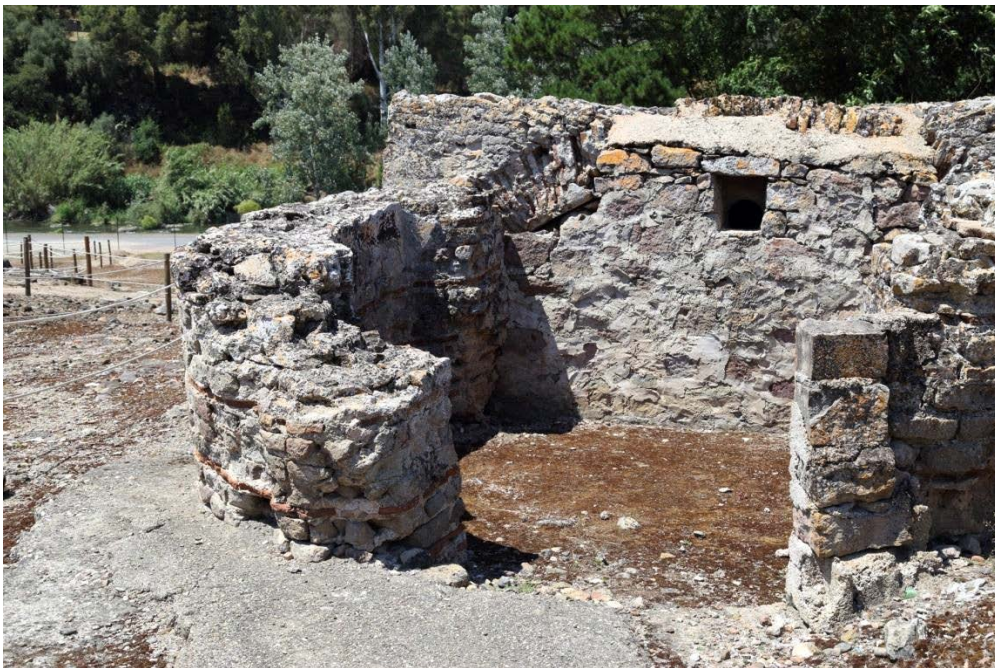
Fig. 3 - Vue du bâtiment depuis le sud, avec la pièce en abside

La salle a une forme rectangulaire avec une petite abside (fig. 3) au sud et une cuvette.