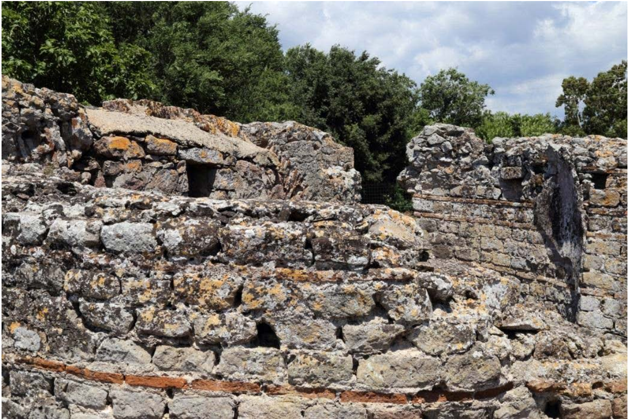
Fig. 4 - Détail de la technique de construction en opus vittatum mixtum

Cette structure n'est plus considérée comme le nymphée depuis la découverte du véritable Nymphée à côté de la natatio ; on ignore donc toujours sa véritable fonction. En l'absence de données de fouilles, et vu les nombreuses interventions de restructuration qu'elle a subies jusqu'à l'époque moderne, le seul élément qui nous permet de la dater est la technique de construction adoptée qui l'associe du point de vue chronologique aux Thermes II.