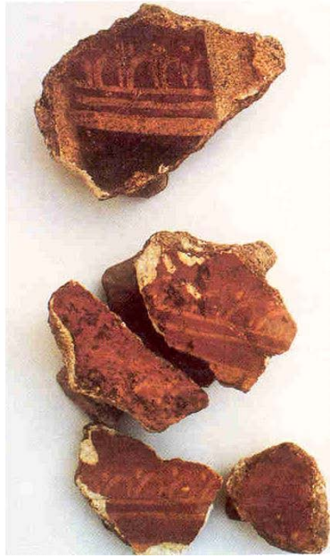
Fig. 2 - Nora. Vestiges de la décoration picturale d'une maison du III e siècle ap. J.-C. (Ghedini, Salvadori 1996, tab. I)