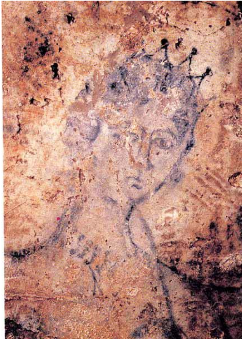
Fig. 4 - Hypogée de San Salvatore di Cabras (Oristano). Visage de Vénus (Donati-Zucca 1992, p. 29).

Dans le contexte culturel, on dispose de témoignages plus nombreux, avec la représentation d'une série d'objets sacrés dans l'hypogée de San Salvatore di Cabras (fig. 4).