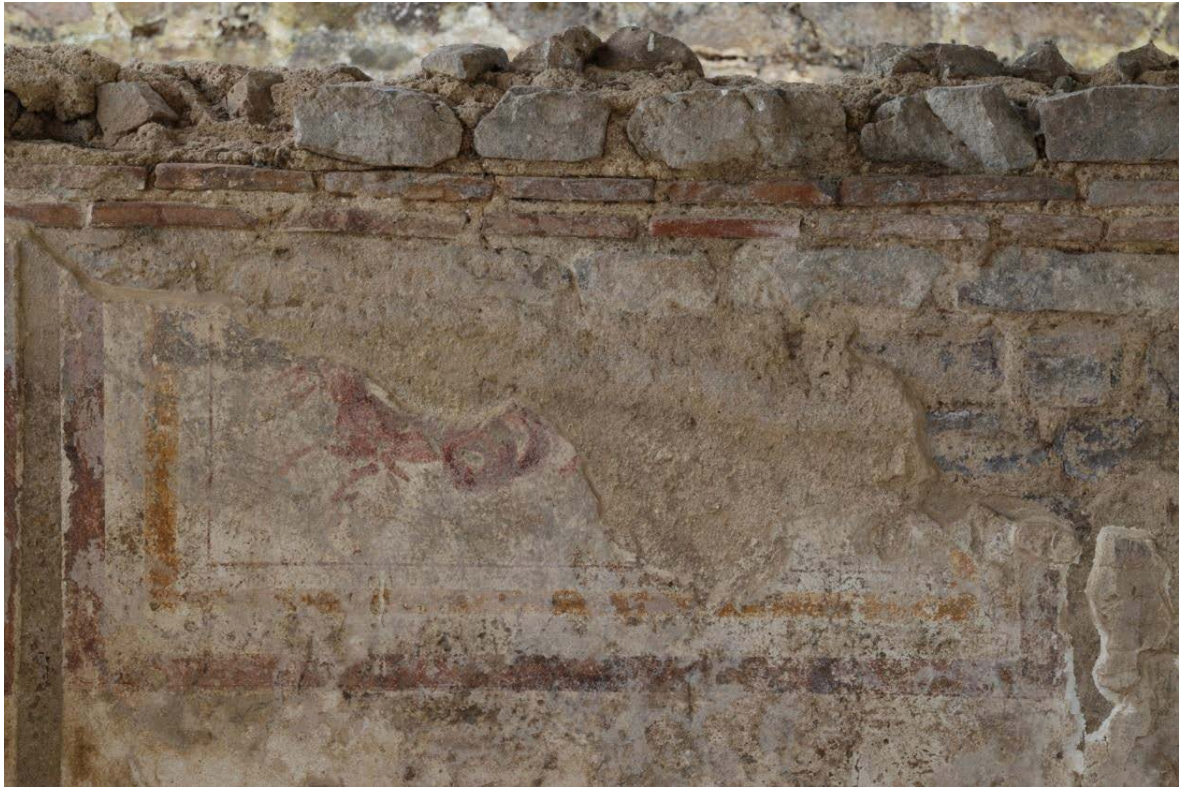
Fig. 4 - Bâtiment en L. Détail du panneau avec scène figurée. Des bandes rouges et jaunes encadrent la figure d'un animal marin fantastique, dans lequel on reconnaît un cheval se terminant par des anneaux de serpent marin.