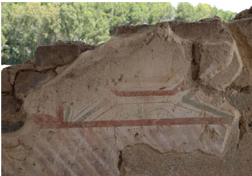
Fig. 5 - Bâtiment en L. Mur décoré de fresques. La partie inférieure est décorée de bandes rouges obliques. Dans la partie supérieure, les bandes rouges encadrent un petit panneau dont la décoration a disparu ; les espaces de passage sont ornés de motifs végétaux.