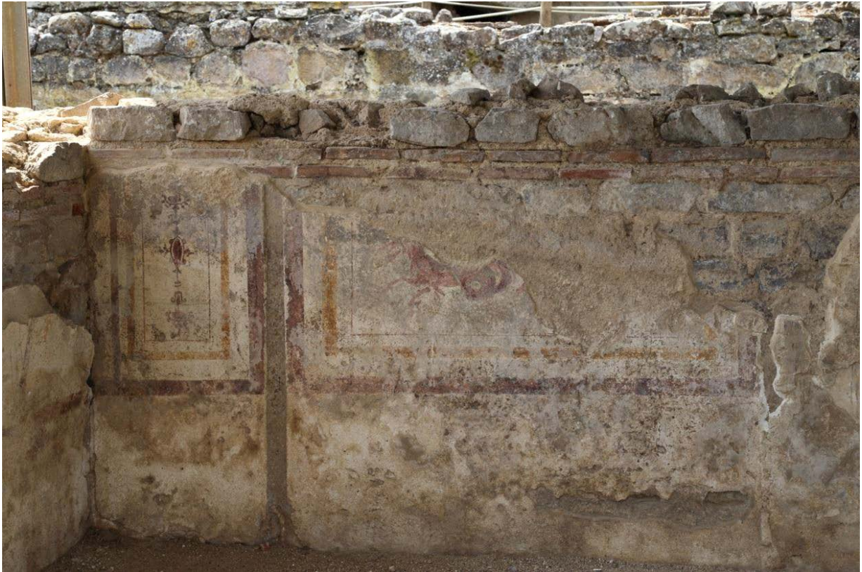
Fig. 2 - Bâtiment en L. Mur décoré de fresques sur panneaux : à gauche, panneaux étroits avec décoration stylisée ; à droite, panneau représentant un animal marin fantastique, datant probablement des II e -III e siècle de notre ère.

L'espace situé au-dessus d'une large bande blanche ou décorée de stries rouges, imitant vraisemblablement le marbre, présente des zones blanches avec des cadres rouges, ocre et/ou verts illustrant des candélabres stylisés (fig. 3) et des animaux fantastiques (fig. 4). Ces motifs sont très fréquents dans le contexte de la peinture romaine avec des formes naturalistes de plus en plus stylisées (fig. 6).