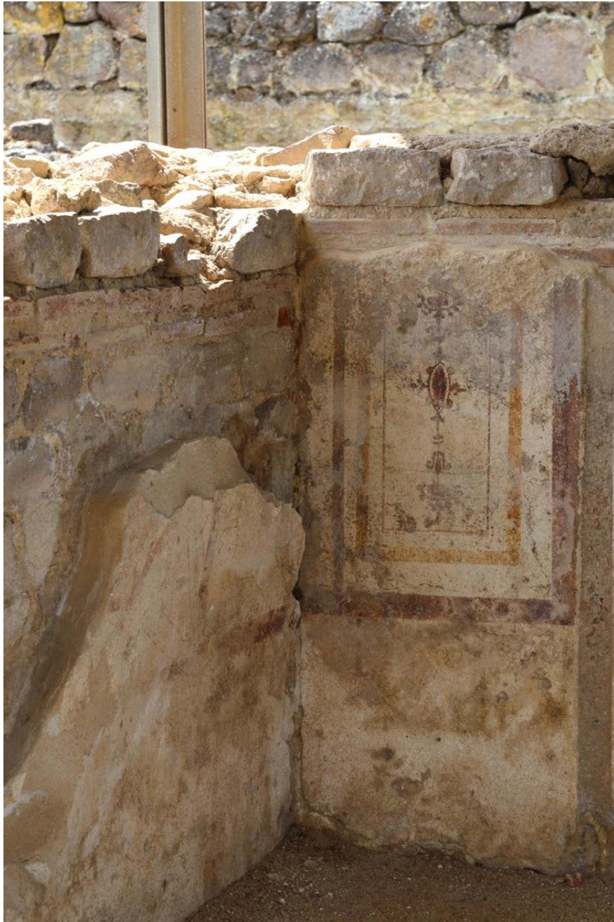
Fig. 3 - Bâtiment en L. Détail du panneau d'angle : des bandes rouges et jaunes encadrent un candélabre stylisé ; II e -III e siècle ap. J.-C.