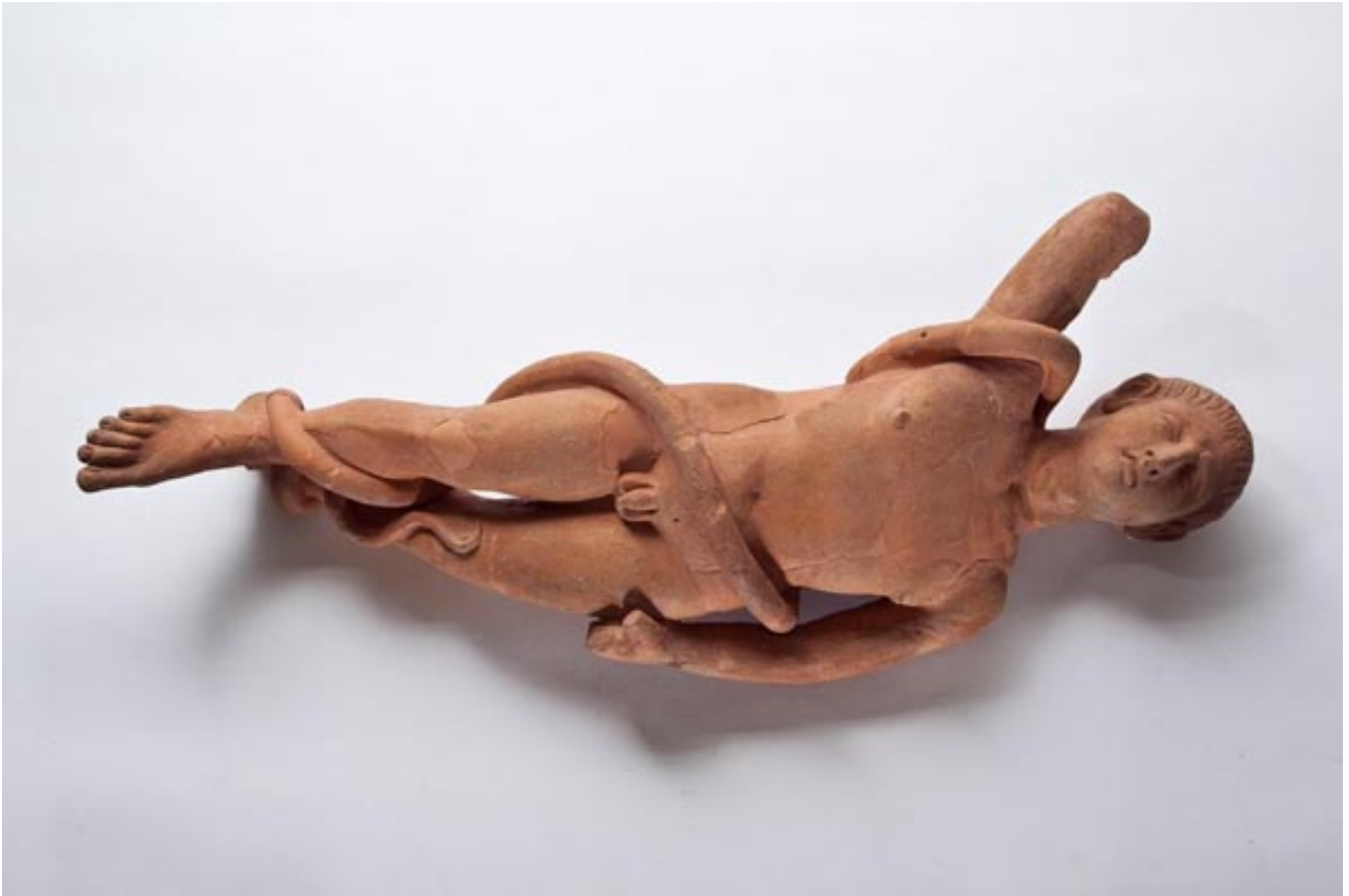
Fig. 2 - Statuette de dévot provenant de Nora, sanctuaire d'Esculape. Le malade est représenté dormant, étreint par les anneaux d'un serpent, l'animal sacré du Dieu.

Très souvent, les ex-voto étaient de simples statuettes en terre cuite, parfois brutes, et les mains indiquaient la partie du corps dont on invoquait la guérison (fig. 3-4).