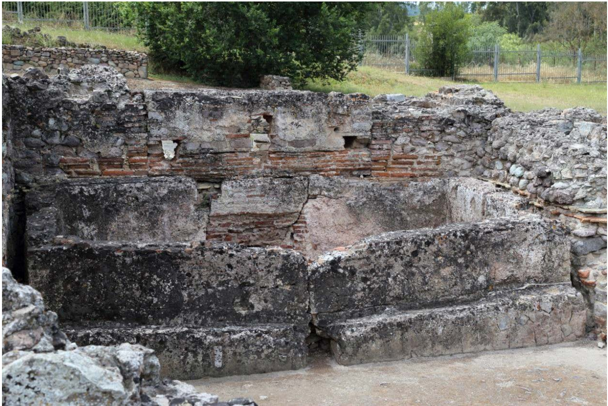
Fig. 2 - Bassin du calidarium.

Le calidarium des Thermes de Fordongianus est mal conservé, mais on le reconnaît grâce à la présence d'un bassin rectangulaire (fig. 2) qui contenait de l'eau tiède pour se rafraîchir, et sur les côtés on aperçoit les restes des tuiles de l'interstice (fig. 3).