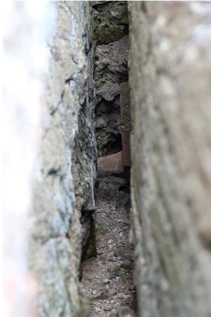
Fig. 3 - Détail de l'interstice entre le bassin et le mur, dans lequel circulait de l'air chaud.

Une niche réalisée dans le mur à côté du bassin devait contenir une statue ornementale aujourd'hui perdue (fig. 4-5).