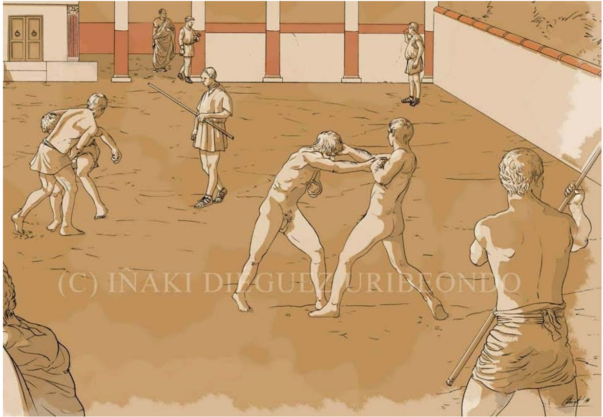
Fig. 4 – Reconstruction du gymnase des Thermes romains de Sebastium , près de Vitoria Gasteiz en Espagne (Facebook “IDU. Ilustración y Dibujo arqueológico”, illustration d'Iñaki Diéguez Uribeondo).