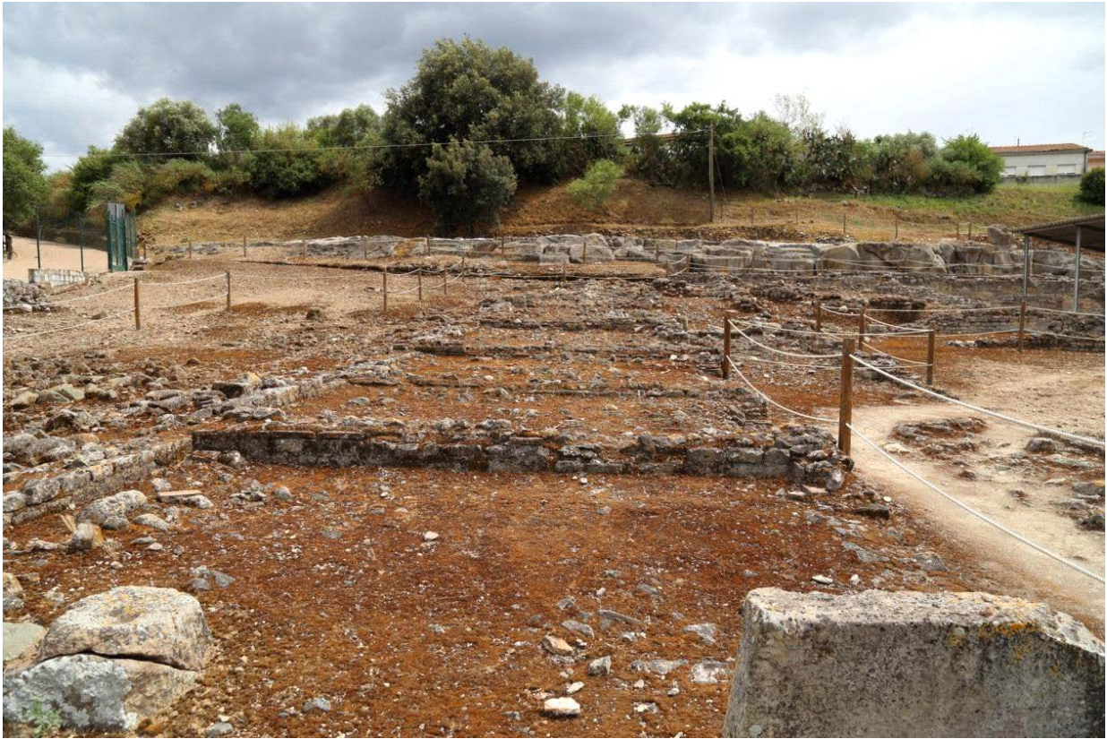
Fig. 3 - Vue des salles adjacentes au gymnase