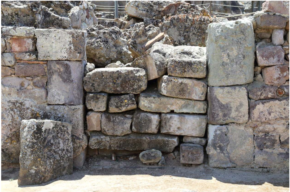
Fig. 2 - Entrée des thermes par la cour

grande entrée donnant dans le frigidarium (fig. 2), et elle servait en même temps de point de passage vers un autre espace ouvert situé à l'est (fig. 1, en bleu clair).