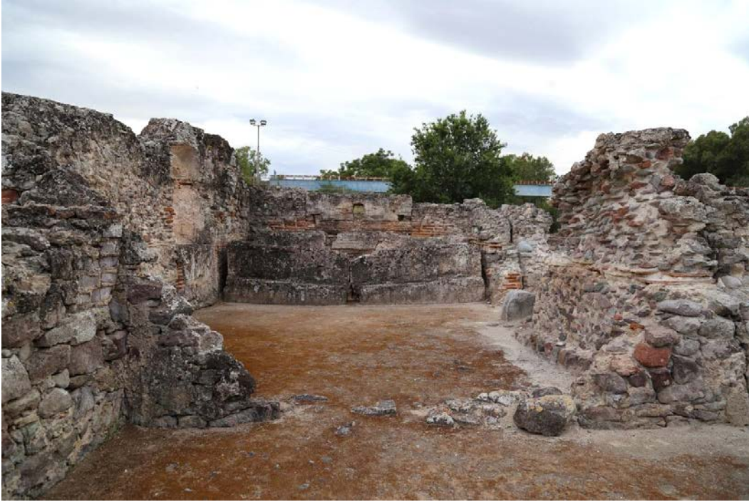
Fig. 3 - Passage du tepidarium au calidarium.