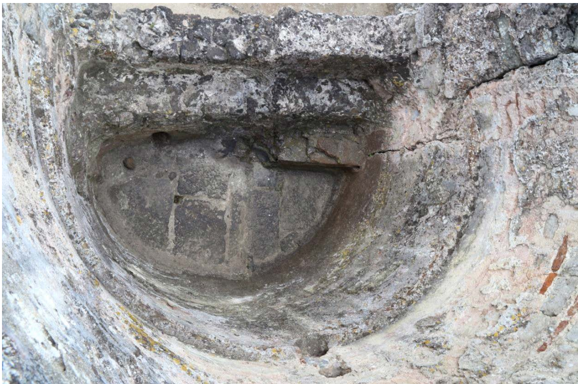
Fig. 4 - Détail du bassin avec les marches d'accès.