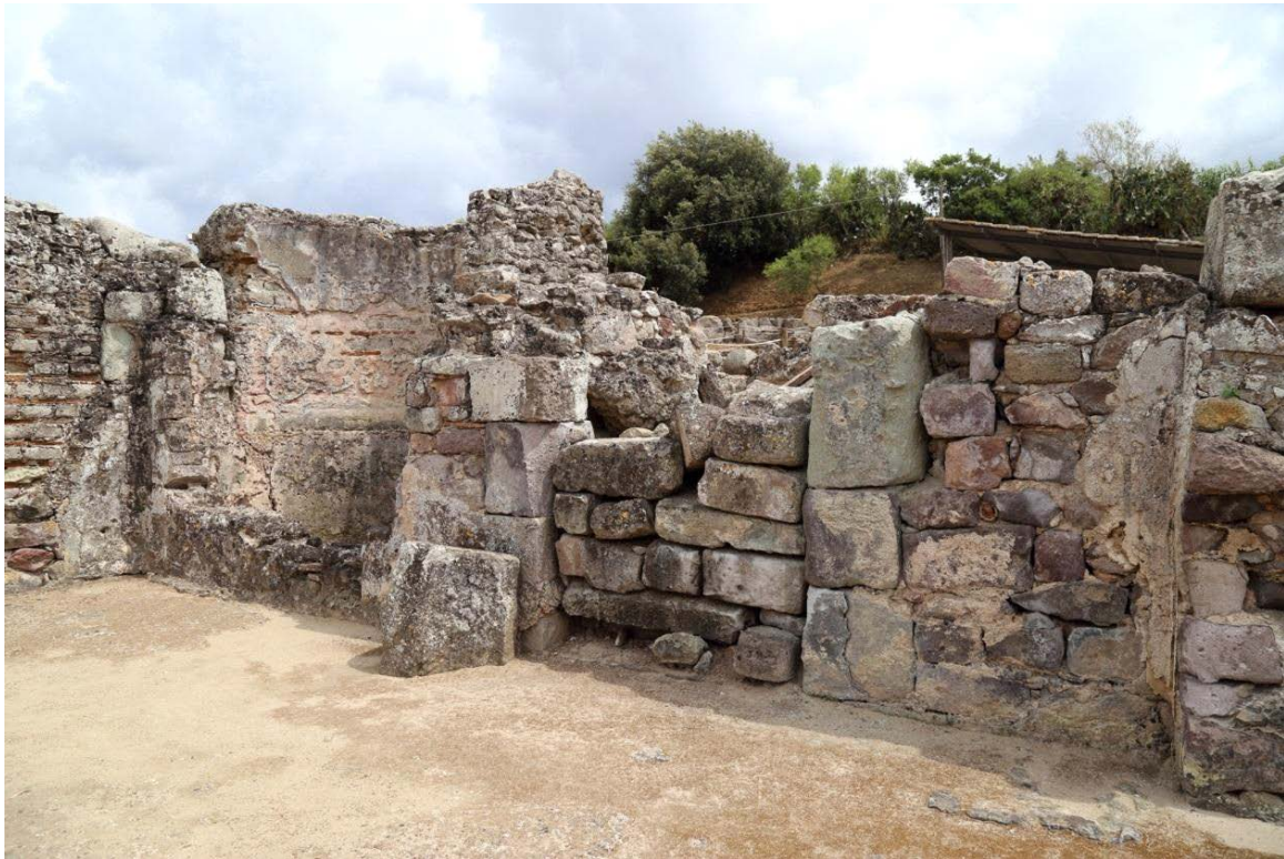
Fig. 2 - Entrée du frigidarium.

Le frigidarium des thermes de Fordongianus, situé dans la zone indiquée sous le nom de Thermes II (fig. 1, salle I), réalisé au cours de la deuxième phase de construction du bâtiment, constitue également le hall d'entrée, comme l'indique la grande porte qui fut refermée au cours de l'Antiquité tardive (fig. 2). Cette salle comprend justement un bassin rectangulaire et un bassin en demi-cercle (fig. 2-4), ayant tous deux des dimensions modestes.