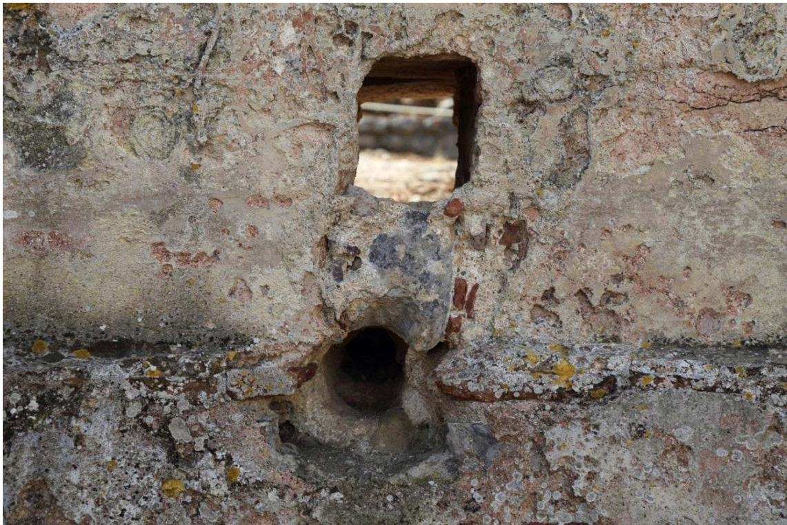
Fig. 5 - Détail des orifices dans la maçonnerie pour le passage des canalisations d'eau.