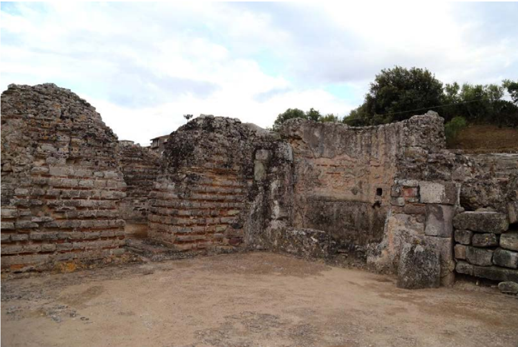
Fig. 3 - Détail du frigidarium des Thermes II, avec une cuvette en abside.