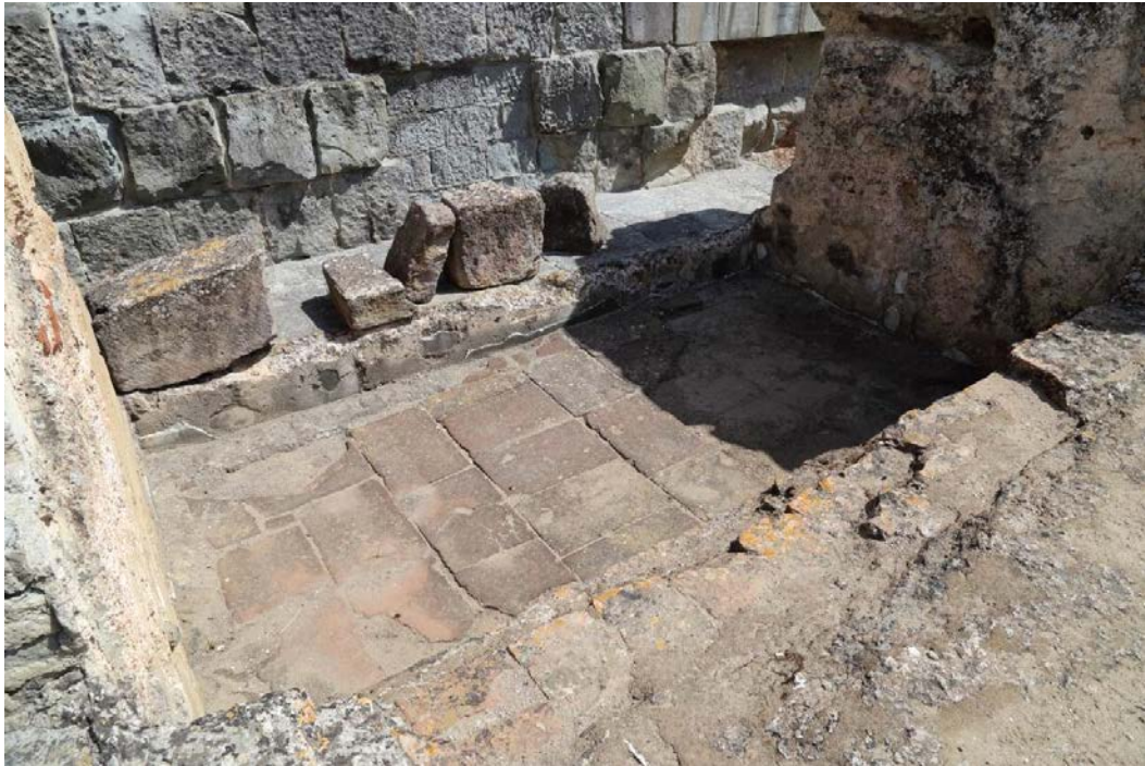
Fig. 4 - Détail du frigidarium des Thermes II.

Ensuite, on traversait dans le tepidarium pour accéder à deux calidaria avec dans l'un d'eux une cuvette contenant de l'eau réchauffée (fig. 5). Les locaux de services avec les fours étaient disposés à l'ouest.