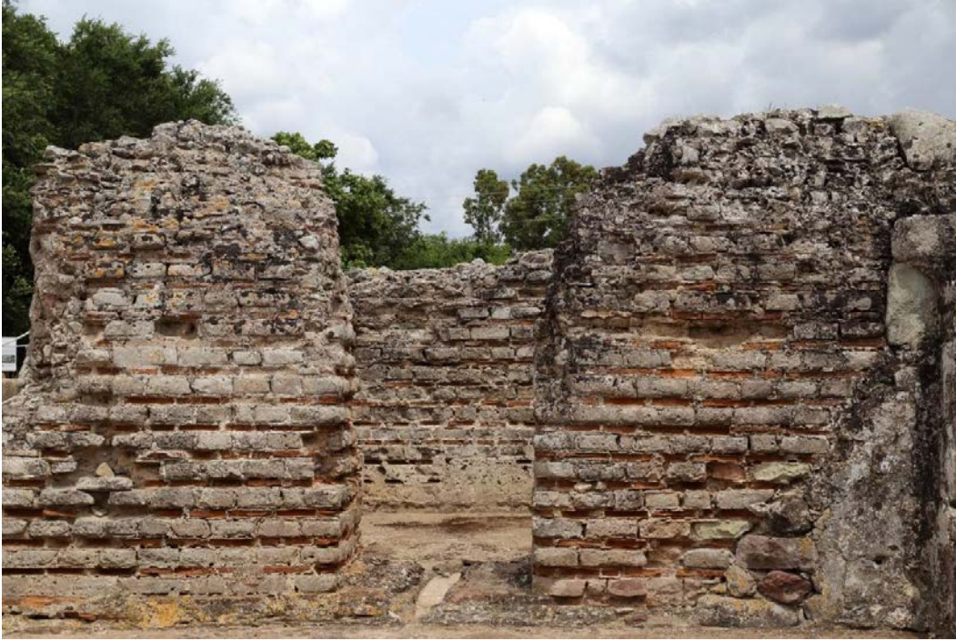
Fig. 2 - Passage du frigidarium à une salle dont la fonction est incertaine ; peut-être s'agissait-il de vestiaires.