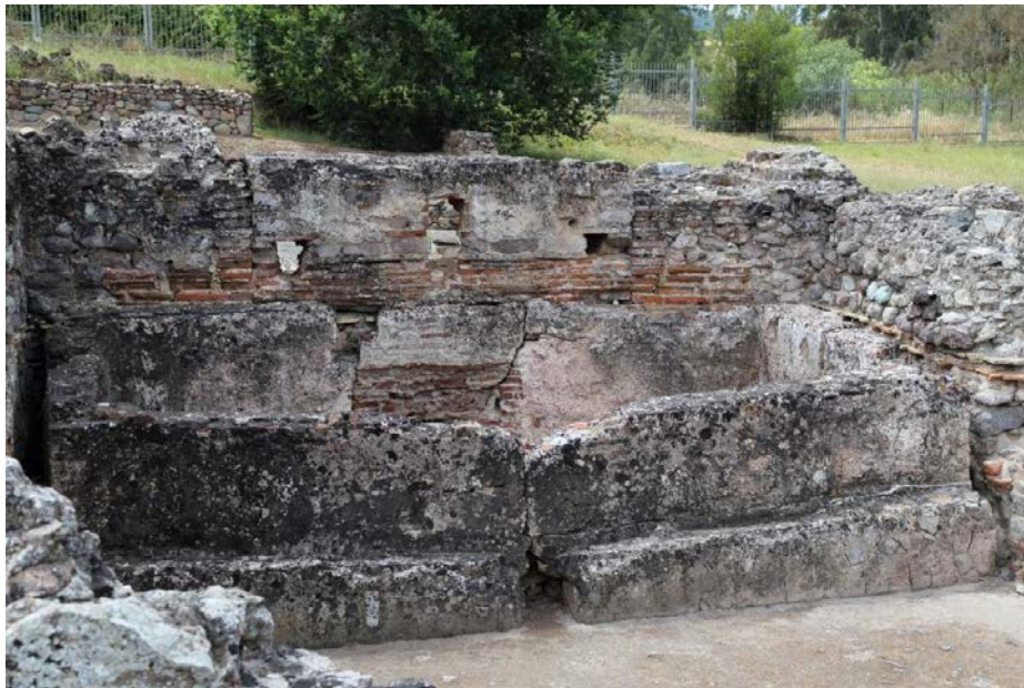
Fig. 5 - Bassin du calidarium.

Ensuite, on traversait dans le tepidarium pour accéder à deux calidaria avec dans l'un d'eux une cuvette contenant de l'eau réchauffée (fig. 5). Les locaux de services avec les fours étaient disposés à l'ouest.