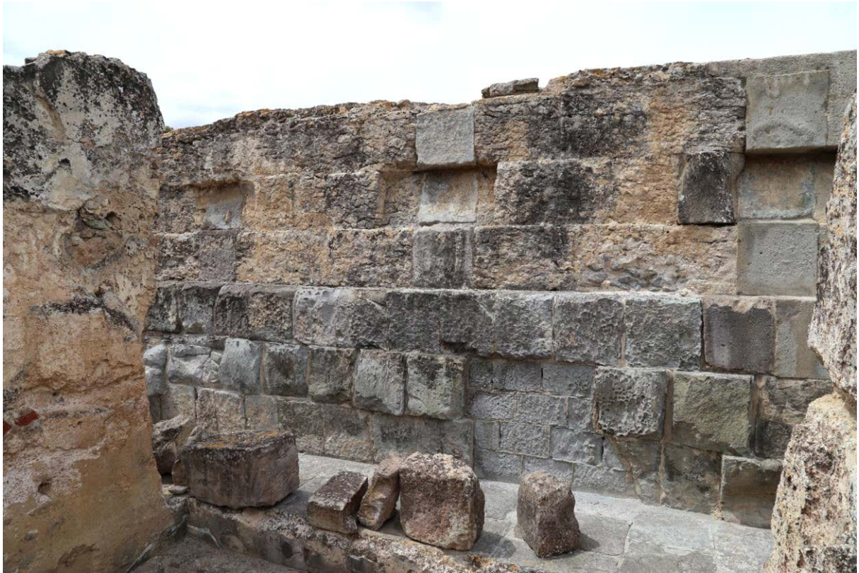
Fig. 2 - La puissante structure des Thermes I réalisée suivant la technique de l' opus quadratum.

Les thermes se sont développés au départ grâce à la présence d'une nappe d'eau naturellement chaude et riche en propriétés curatives, ce qui justifie également les nombreuses dédicaces aux Nymphes et au dieu Esculape. Le cœur du bâtiment et la grande piscine ( natatio , fig. 3-4) où l'on réglait la température de l'eau thermale qui jaillissait à 54° en ajoutant de l'eau froide.