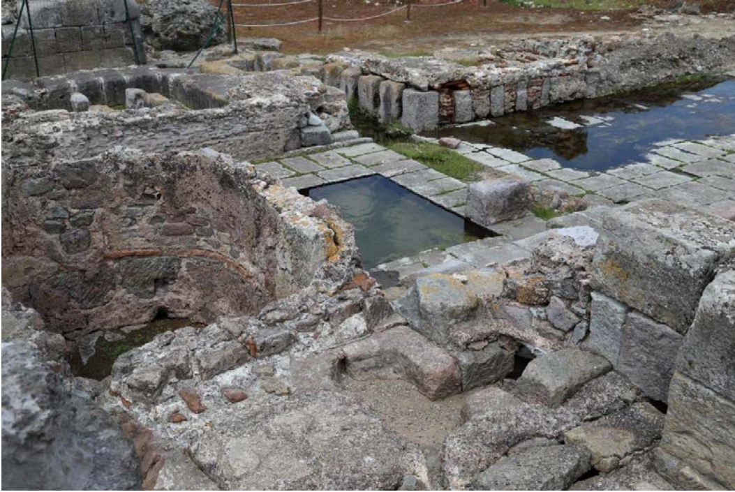
Fig. 5 - Les locaux de service des Thermes I