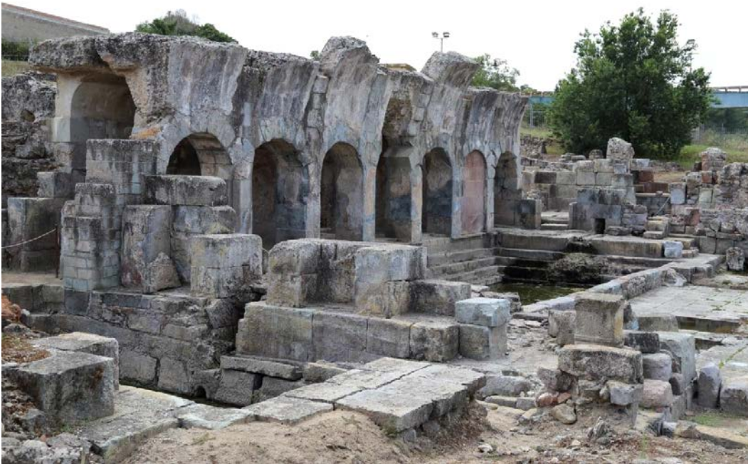
Fig. 3 - Le noyau des Thermes I : la natatio et au premier plan le Nymphée.