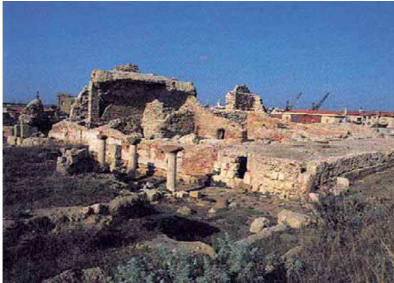
Fig. 2 - Porto Torres, Thermes soi-disant Palazzo di Re Babaro Mastino-Vismara 1994, frontispice)