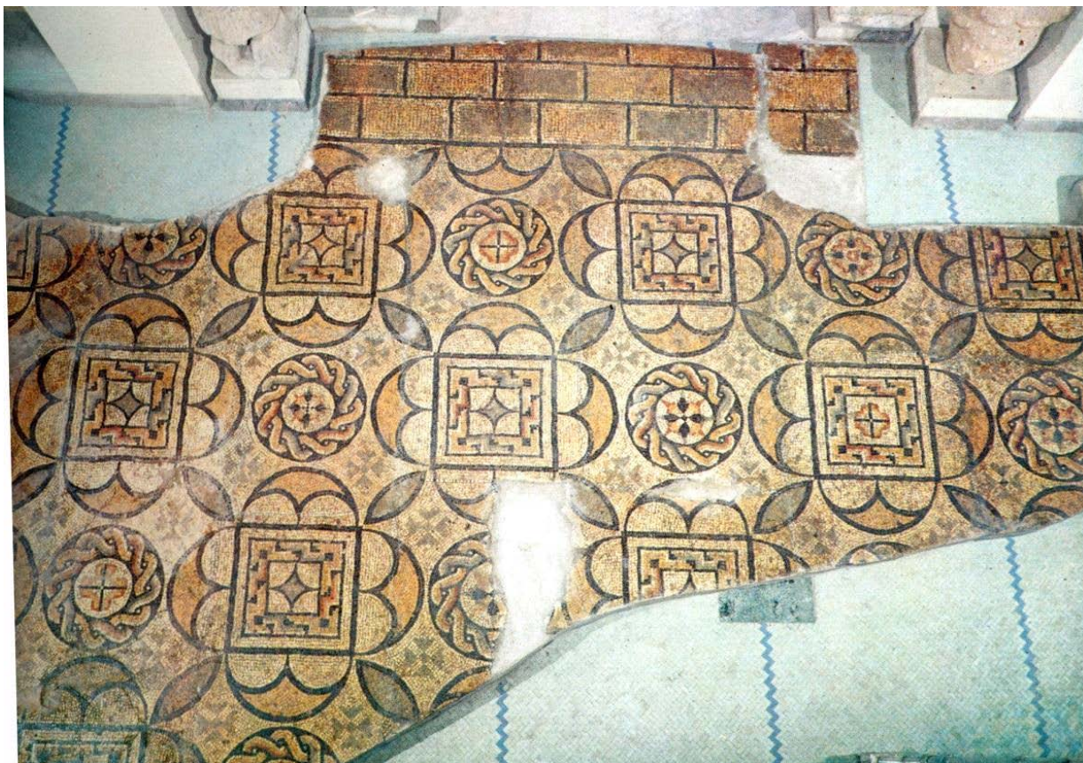
Fig. 3 - Sol en mosaïques découvert dans le village de Fordongianus (Angiolillo 1981, tab. XLIV)