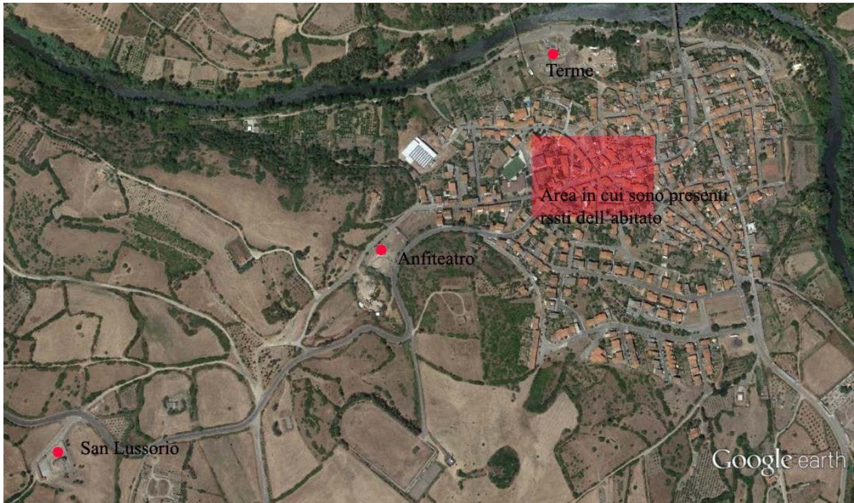
Fig. 2 - Le territoire de Fordongianus avec l'indication des principaux sites (Google Earth ; réélaboration de C. Tronchetti).

On a également récupéré des bornes miliaire appartenant à d'autres routes ainsi que des tronçons de voies à proximité du pont sur le Tirso ainsi que les ruines de l'aqueduc, non loin de là. On a également identifié sporadiquement des restes de rues urbaines et de bâtiments résidentiels (fig. 3) dans la ville actuelle, et quelques sépultures isolées identifiées dans les alentours au début du siècle dernier.