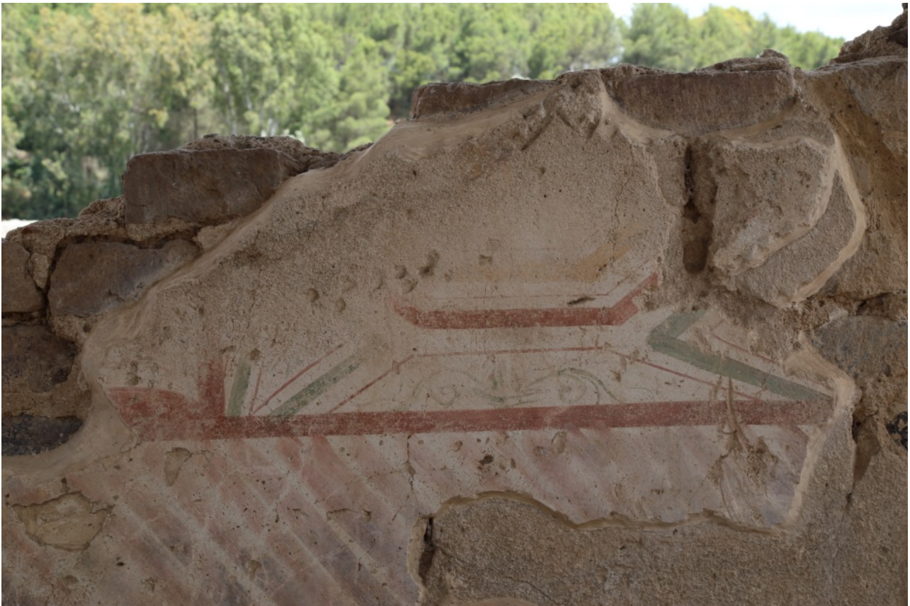
Fig. 6 - Murs décorés découverts dans une pièce lors des fouilles de 1980.

Au cours des années successives, on réalisa des chantiers pour l'entretien des vestiges, jusqu'en 1980, quand Carlo Tronchetti découvrit des murs peints datant probablement du III e siècle de notre ère à l'intérieur d'une des pièces mises au jour en 1969 (fig. 6).