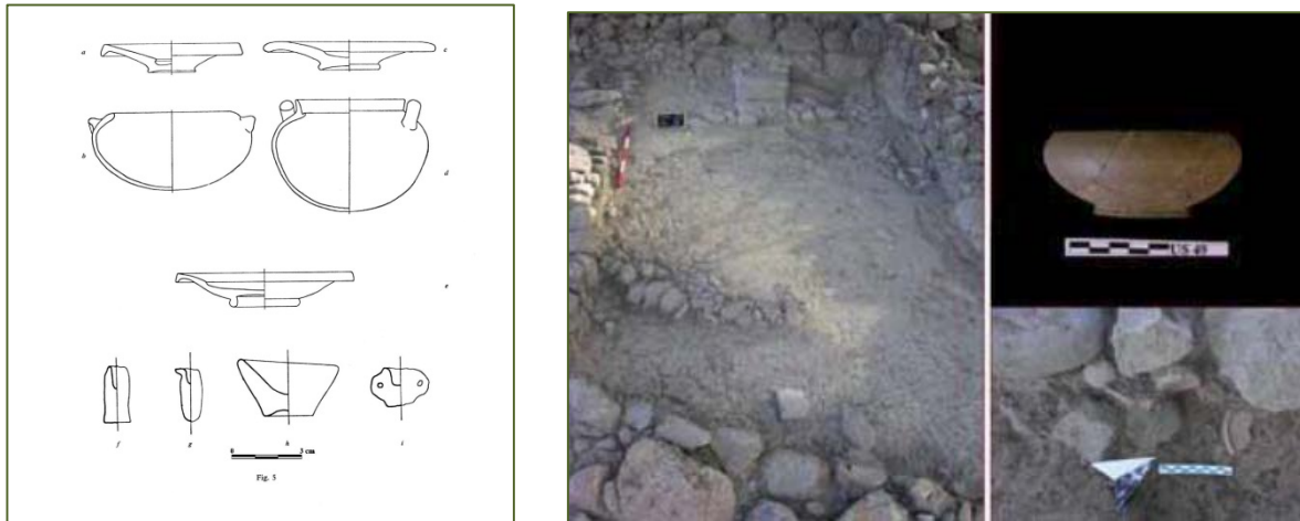
Fig. 1, 2 - Céramiques provenant du tophet (BARTOLONI 1982, fig. 5), datant du II e siècle av. J.-C. provenant du village, secteur C64 (GUIRGUIS 2013, fig. 24).

Cette phase chronologique a été jusqu'à présent assez peu représentée dans les nécropoles découvertes et fouillées à Monte Sirai, même si le développement des recherches, vu la documentation urbanistique et la chronologie même du tofet (fig. 1-2), devra nécessairement fournir une documentation de plus en plus importante, grâce à l'identification des sépultures de la communauté qui vécut à Monte Sirai au cours de ces deux siècles et demi.