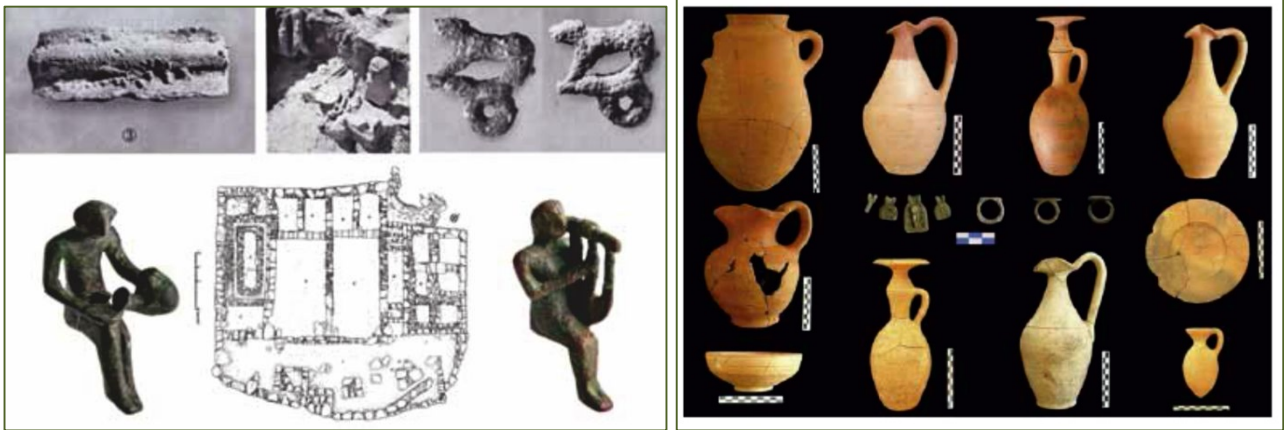
Fig. 3, 4 - Matériel provenant du temple d'Astarte (GUIRGUIS 2013, fig. 5-6) ; céramique phénicienne de la fin du VII e à la fin du VI e siècle av. J.-C. provenant des tombes archaïques de Monte Sirai (GUIRGUIS, POMPIANU, UNALI 2012 tab. 17).

Les formes phéniciennes typiques sont l' oinochoe , ou cruche, présentant un bord en forme de champignon et la cruche à bec lobé de différentes formes, souvent caractérisée par la technique red slip , ou peinture rouge brillante, ainsi que des assiettes peintes, des tripodes, des coupes et des lampes à huile.