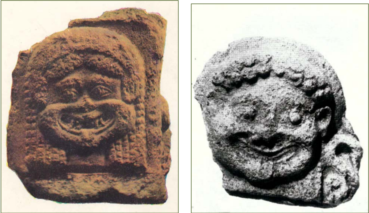
Fig. 3, 4 - L' arula avec gorgoneion (MONTE SIRAI - IV, couverture) ; antéfixe provenant de Mendolito di Adriano, fin du VI e siècle av. J.-C. (ALBANESE PROCELLI 1990, fig. 19).

cadre décoré. L'archéologue date l'objet du II e siècle avant notre ère, mais on ne peut exclure son appartenance à la période carthaginoise. Les comparaisons, du moins pour les archétypes, conduisent en Sicile et dans la Grande-Grèce.