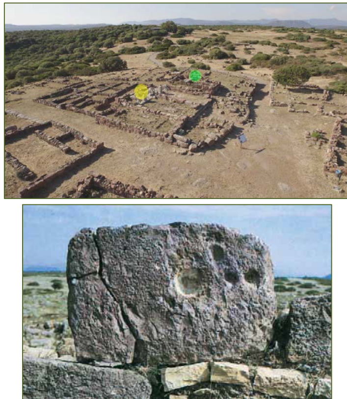
Fig. 3, 4 - Le temple d'Astarte (réélab. photo Unicity 2015) et le menhir avec des cavités (BARTOLONI 2004, fig. 4).

Toujours dans le secteur du complexe sacré (fig. 3 en vert), mais appartenant cette fois très probablement à des temples bien antérieurs aux constructions phéniciennes, on a découvert une pierre décorée avec des cavités (fig. 4), provenant d'un des deux menhirs retrouvés dans le secteur de la soi-disant tour-carrière.