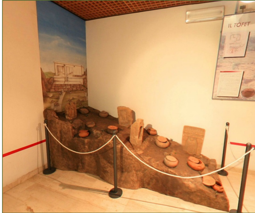
Fig. 5 - Reconstruction d'une partie de la zone du tofet de Monte Sirai.

Le musée est lié aux monuments du territoire : le service proposé, les efforts fournis, les initiatives publiques visant un développement basé sur la culture le paysage qui devrait apporter du savoir et une nouvelle richesse, méritent notre admiration.