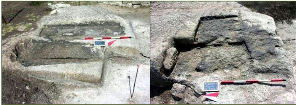
Fig. 3 - Secteurs destinés à l' ustrinum collectif (GUIRGUIS 2012, fig. 6).

Du point de vue historique et culturel, on peut supposer la présence simultanée, parallèlement aux centres carthaginois liés aux tombes à chambre creusées dans la roche, d'autres souches et populations : certaines d'entre elles, au moins en partie autochtone, sont encore liées aux traditions phéniciennes précédentes. Il faut également rappeler les fréquentations du site à une époque très ancienne, car on y a découvert non loin de la nécropole carthaginoise des niveaux relatifs à la culture énéolithique sarde de Monte Claro (qui montrerait également dans ce cas une préférence pour l'installation sur les hauteurs).