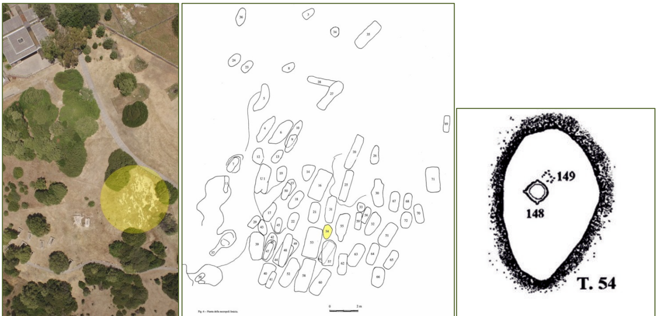
Fig. 1, 3 - Vue du haut de la nécropole phénicienne ; emplacement de la tombe à fosse et planimétrie (BARTOLONI 2000, fig. 7 ; 17).

La tombe n° 54 est une petite tombe à fosse à l'intérieur de la nécropole phénicienne (fig. 1), située dans le secteur méridional (fig. 2-3). Elle appartient à un enfant qui y fut enseveli suivant le rituel de l'incinération, entre la fin du VII e et le début du VI e siècle avant J.-C. La couche de cendre contenant le matériel organique indique que le bûcher avait été réalisé dans la fosse.