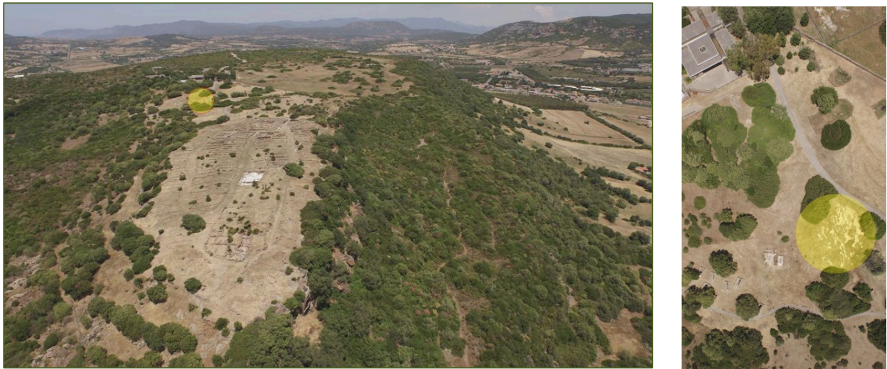
Fig. 1-2 - Le secteur de la nécropole phénicienne (signalée) : photo Unicity S.p.A. ;

La nécropole phénicienne qui date de la période comprise entre la fin du VII e siècle avant J.-C. et le siècle suivant, constitue le groupe des tombes les plus anciennes documenté jusqu'à présent à Monte Sirai.