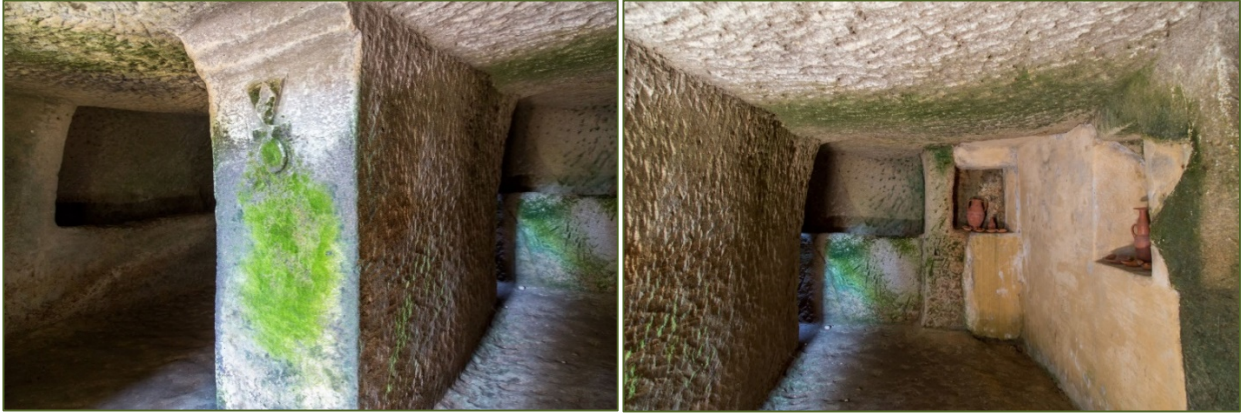
Fig. 4, 5 - Pilier avec le symbole de Tinnit et niches contenant des reconstructions des mobiliers en céramique ;