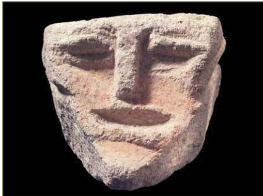
Fig. 4 - La tête sculptée à l'origine dans le plafond (GUIRGUIS 2013, fig. 47).).

Malheureusement, les interventions clandestines qui ont également concerné l'ensemble de Monte Sirai, firent tomber la tête sculptée au plafond, heureusement récupérée et conservée aujourd'hui au Musée Archéologique National de Cagliari.