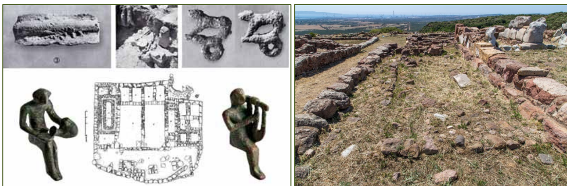
Fig. 3, 5 - Le « temple d'Astarte » et la zone du bassin (photo Unicity S.p.A.) ; planimétrie et objets archaïques (GUIRGUIS 2013, fig. 3).