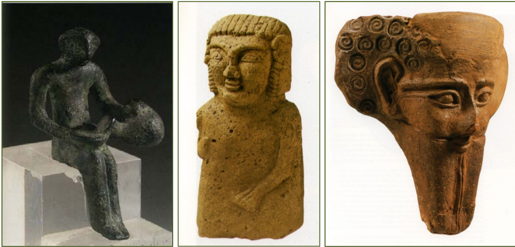
Fig. 6 - 8 - Statuette phénicienne en bronze (MOSCATI 1988b, p. 427) ; statue d'Astarté (MOSCATI 1988b, p. 286) ; protomé égyptisante (MOSCATI 1988, p. 362)

C'est à cette phase qu'appartiennent les bronzes nuragiques et phéniciens ; l'un d'entre eux, bien connu en Sardaigne (retrouvé à proximité du nuraghe Sirai), et qui est l'emblème de la rencontre entre les Phéniciens et la population nuragique, illustre une libation effectuée avec une cruche analogue aux pichets nuragiques de type askoïde (fig. 5-6).