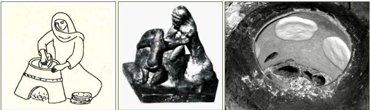
Fig. 4 - 6 - Préparation du pain (CAMPANELLA 2008, p. 146 ; DI GENNARO, DEPALMAS 2011, fig. 2b ; terre cuite provenant de la tombe carthaginoise de Carthage, femme et enfant autour d'un tannur : DI GENNARO, DEPALMAS 2011, fig. 3)

Il s'agit de dolii toujours utilisés dans les régions plus traditionnelles d'Afrique du Nord. On en rencontrait parfois dans le monde phénicien et carthaginois avec des empreintes profondes de doigt à l'extérieur de la lèvre.