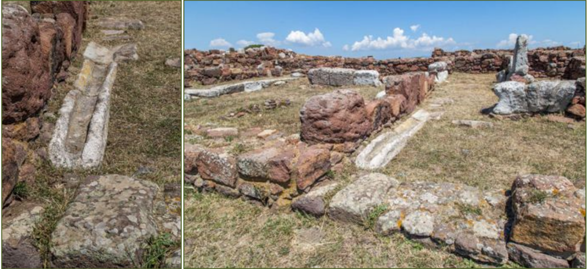
Fig. 5, 6 - Rigole en calcaire et son raccordement à la route.

L'utilisation de grands blocs en opus quadratum comme les murs porteurs était plutôt significative (fig. 7).