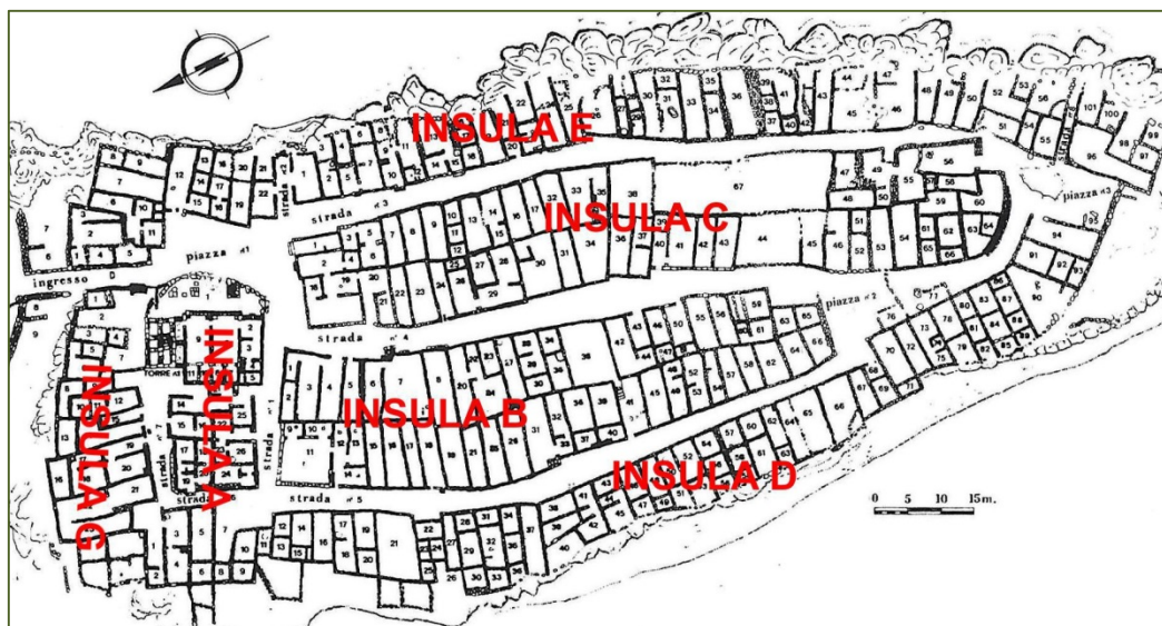
Fig. 2 - Monte Sirai, planimétrie (réélaboration de GUIRGUIS 2013, fig. 11)

Les phases les plus anciennes du site - qui fut précédé par une fréquentation néo-énéolithique et nuragique - datent probablement du VIII e siècle avant notre ère. Ensuite, au cours du VII e et du VI e siècle av. J.-C., tout le haut plateau fit l'objet d'une intense activité de construction : c'est de cette époque que date la nécropole à incinération archaïque.