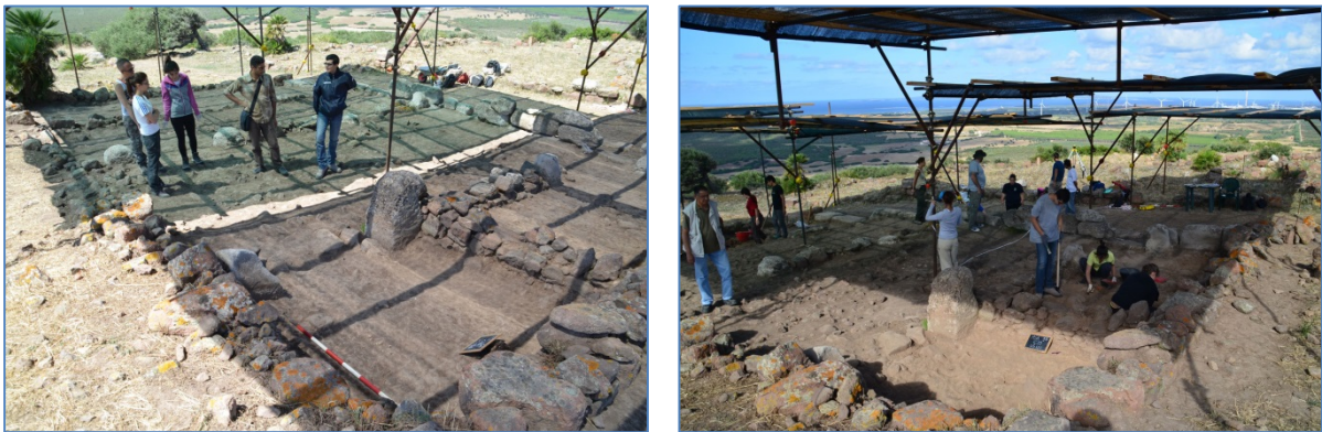
Fig. 6, 7 - Monte Sirai, Juin-Juillet 2015: fouilles dans la 'tuff House'.