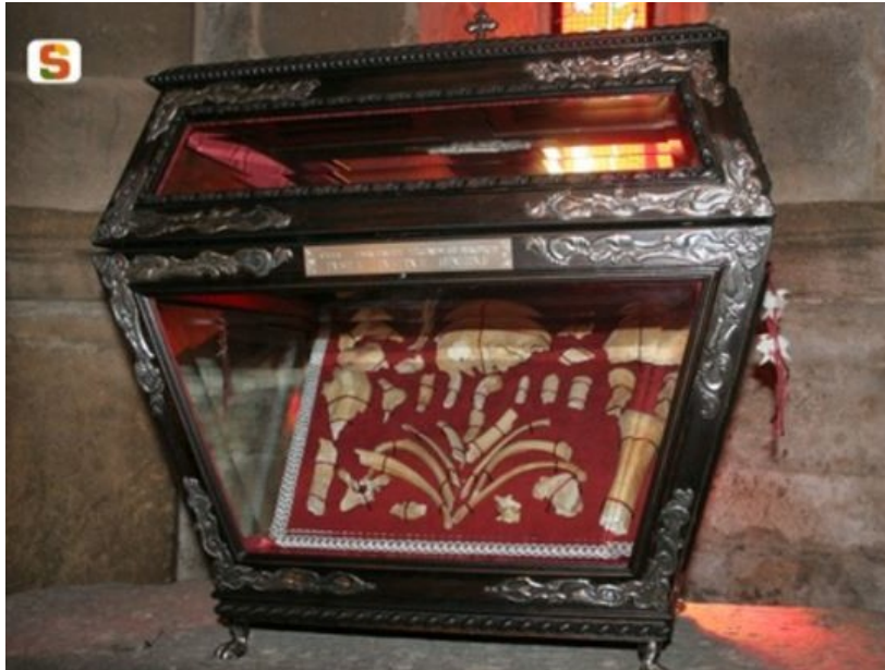
Fig. 4 - Relicario que contiene las reliquias de Santa Justa, basílica de Santa Justa (S. Giusta) ( http://www.sardegna.digitallibrary.it/index.php?xsl=626&id=48684 ).