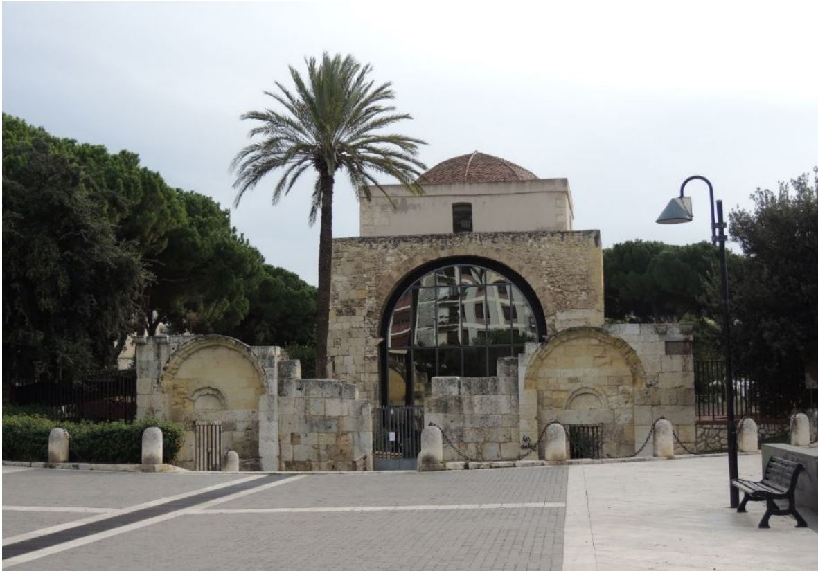
Fig. 1 - La basílica de S Saturnino.