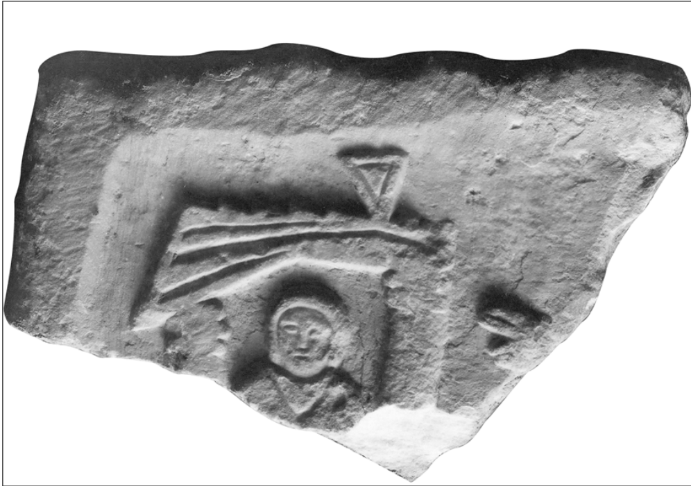
Fig. 1 - Fragmento con la representación de Saturnino/Lázaro, Cagliari, área de di S. Saturnino (de Pesce 1957, fig. 85)