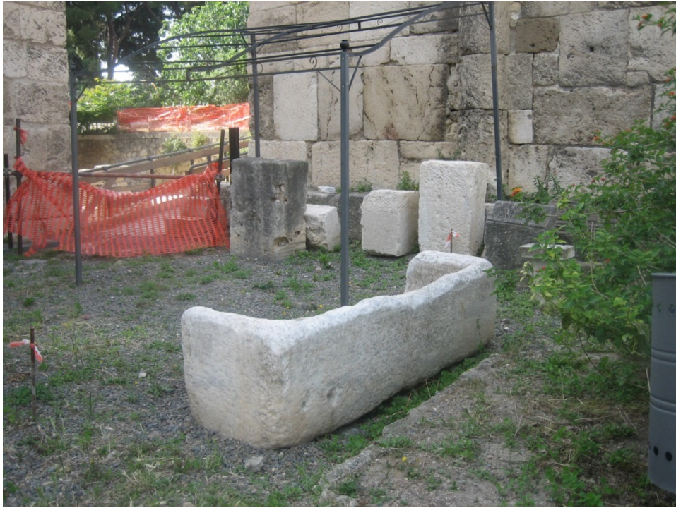
Fig. 3 - Sarcófago de Bonifatius.